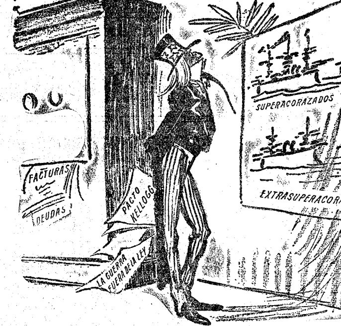
EL PACTO KELLOGG O UN DESENLAZC A LA AMERICANA ("La Victoire", París.)