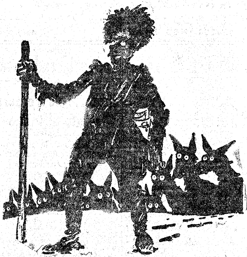
TROTSKI, CONDUCTOR DE LOBOS, BUSCA UN ASILO