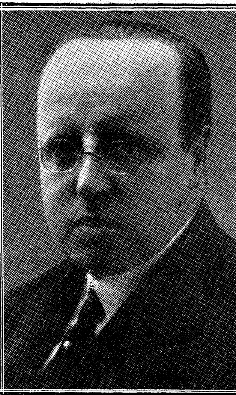
Don Luis Martínez Kléiser, que ha publicado una interesante novela titulada "Talegos de Talegas".

Don Luis Martínez Kléiser nació en Madrid en 1883. Hizo sus estudios en la Universidad Central y los terminó en 1903. Dedicóse entonces con gran entusiasmo a los estudios literarios y a la política, llegando a ser alcalde de Madrid. Es autor de numerosas novelas, entre las que descuellan: "Rarezas", "El vil metal" y "La obispilla". También ha publicado varios libros de poesías, como el titulado "De hondos sentimientos", prologado por don Francisco Rodríguez Marín. Es autor de diversos trabajos de investigación y ha colaborado en numerosas revistas y periódicos.