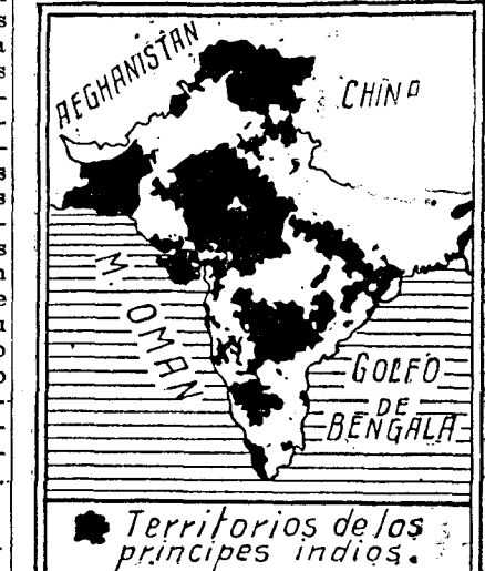
Territorios de los príncipes indios.