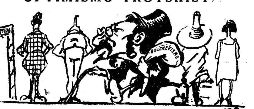
—Mejor si ando mucho. La Tierra es redonda.