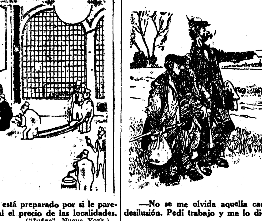
—Todo está preparado por si le parece mal el precio de las localidades.