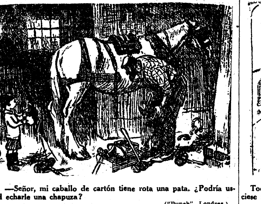
—Señor, mi caballo de cartón tiene rota una pata. ¿Podría usted echarle una chapuza?

Por último, se ocupó de la participación en esta provincia en el gran Congreso y Exposición misionales que ha de celebrarse en Barcelona.