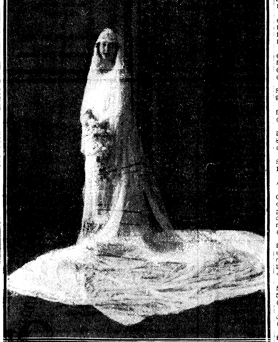
Modelo de la CASA SANMANTON, Barquillo, 5