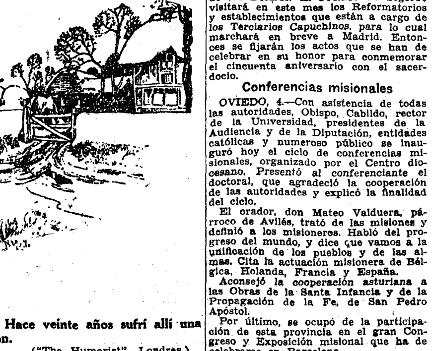
—No se me olvida aquella casa. Hace veinte años sufrí allí una desilusión. Pedit trabajo y me lo dieron.