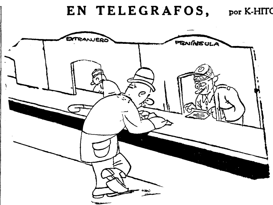
—Hombre, por mera curiosidad, ¿cómo es que usted cuenta diez y seis palabras y yo quince solamente? —¡Qué gracioso! Quince, y la palabra que le he dado de que llegará esta tarde, diez y seis.