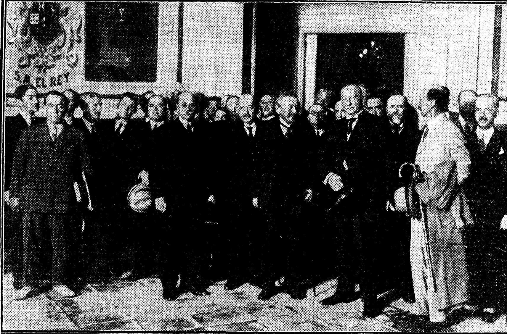
Llegada de personalidades extranjeras para asistir a la reunión del Consejo de la S. de N. Briand (a la derecha de Primo de Rivera) y el conde de Bethlen (a la izquierda)...

Deseo comprar finca de cultivo, y a ser posible, con pastos y arbolado. Dirigirse, indicando precio y detalles, al Apartado 9.068. Madrid.