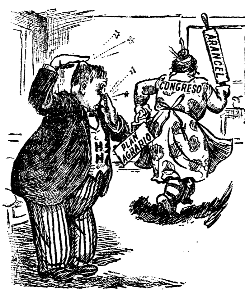
HA TERMINADO LA LUNA DE MIEL ("The World Herald", Omaha.)