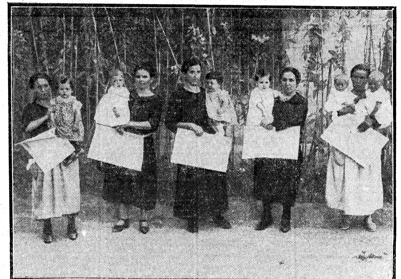
Las madres a quienes se han concedido los primeros premios en el concurso de Madres Lactantes, celebrado en Valencia con motivo de las ferias

BUCAREST, 26.—La Cámara ha aprobado los nuevos aranceles, que introducen reducciones, aunque no en muy grande escala, en los derechos sobre la importación.