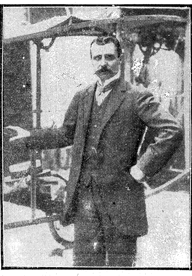
Bleriot, en la época en que hizo la primera travesía aérea del Canal de la Mancha

EPISTOLARIO Viudo que se consuela (Granada).—Indudablemente, y desde el punto de vista de lo que se acostumbra en esos casos, la familia de su prometida es la que está en lo cierto, o sea que usted ha debido presentar a su hermano.