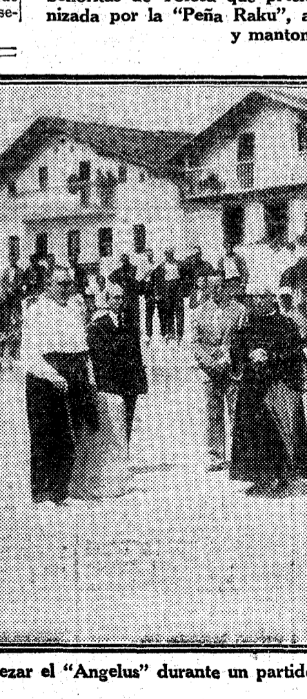
Momento de rezar el "Angelus" durante un partido de pelota a rebote

Señoritas de Tolosa que presidieron la becerrada benéfica organizada por la "Peña Rakú", ataviadas con las clásicas mantillas y mantones de Manila.