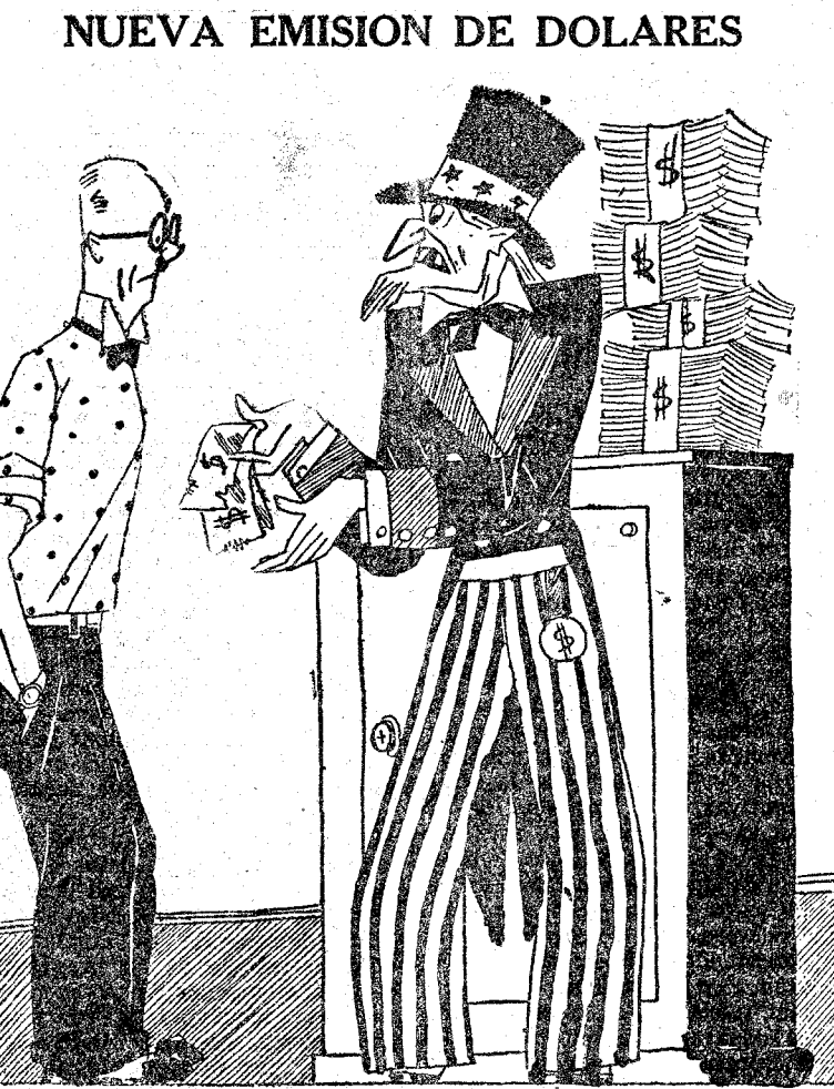
"Por razones de higiene el Gobierno americano va a reemplazar los billetes viejos."

Entre las disposiciones insertas en el "Boletín Oficial" de la zona de Protectorado español en Marruecos, correspondiente al 25 de junio último, figura un decreto de la Alta Comisaría reorganizando las Intervenciones militares de Meilla y del Rif y las plantillas de las mismas. Otra aprobando la distribución de los créditos globales contenidos en el vigente presupuesto de la zona y detalle de la relación de los artículos del presupuesto del Majzén para el año 1929. Dahir disponiendo el cambio de denominación de Punta Pescadores por el de Puerto Capaz, como homenaje al coronel de dicho apellido. Decreto vijual aprobando las reglas a que deberá ajustarse la enajenación de terrenos para construir y que son propiedad del Majzén en Río Martín, y pliego de condiciones que han de regir en el contrato de las obras de construcción del edificio para centro de las instituciones sanitarias en Tetuán.