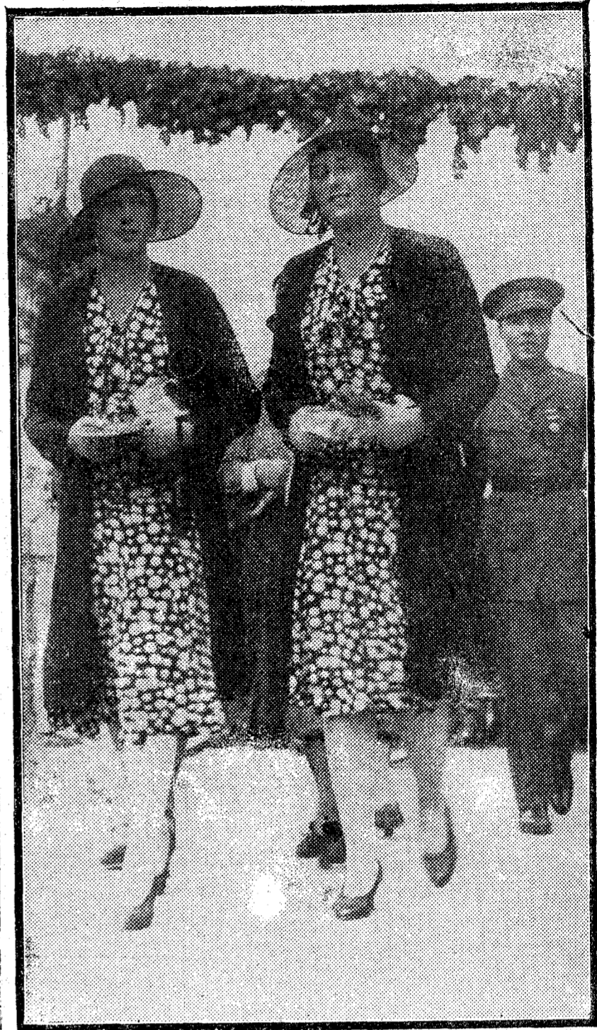
Sus altezas reales las infantas doña Beatriz y doña Cristina al salir de la tómbola de la Cruz Roja, en Santander.