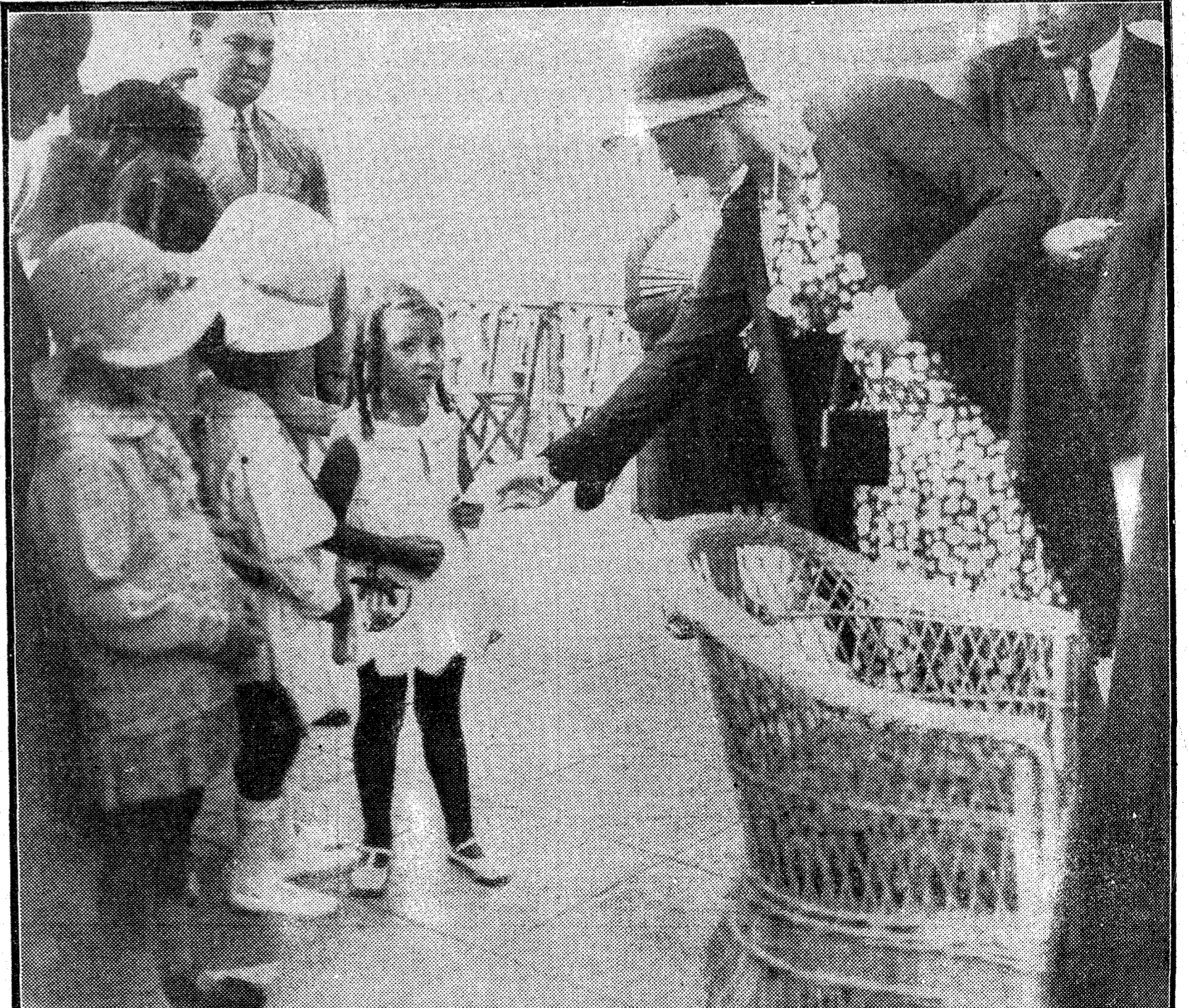
Su alteza real la infanta doña Cristina regalando a varias niñas billetes de la tómbola a favor de la Cruz Roja.