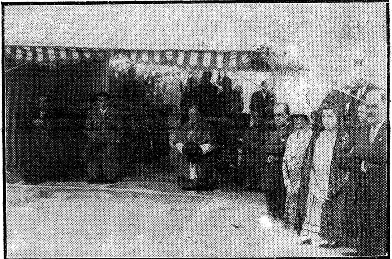
El infante don Jaime en la misa en que se bendijo la bandera de los Exploradores