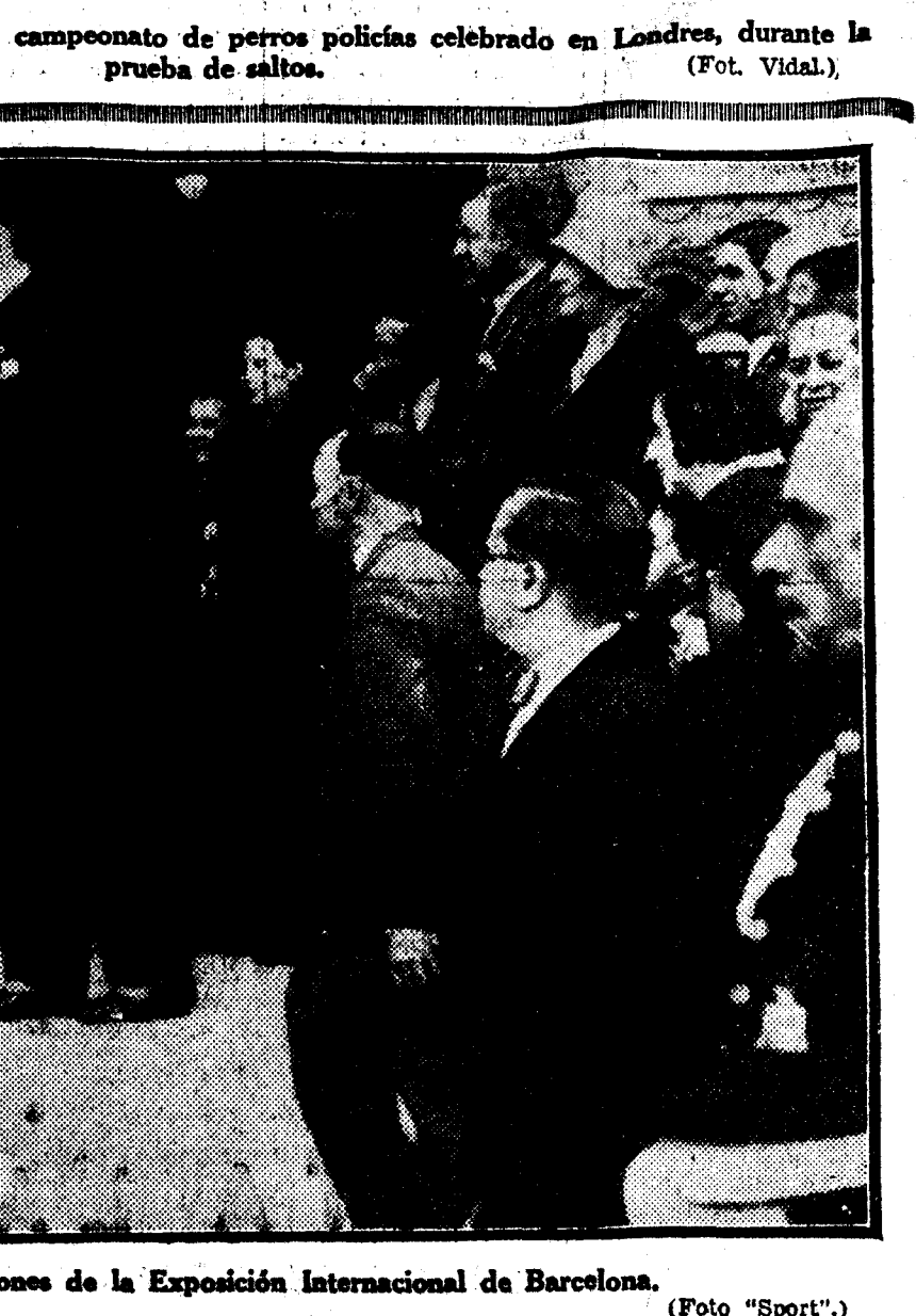
El Rey al salir de visitar el Pabellón de las Misiones de la Exposición Internacional de Barcelona.

MOSCÚ, 28.—La Agencia Tass dice que la Academia de Ciencia de Moscú ha aprobado un proyecto de reforma del calendario, en el que se prevé la semana de cinco días—del lunes al viernes inclusive—, el mes compuesto de seis semanas y el año de trescientos sesenta días, independientemente de otros seis días de fiesta en honor de la revolución, que se contarán aparte.