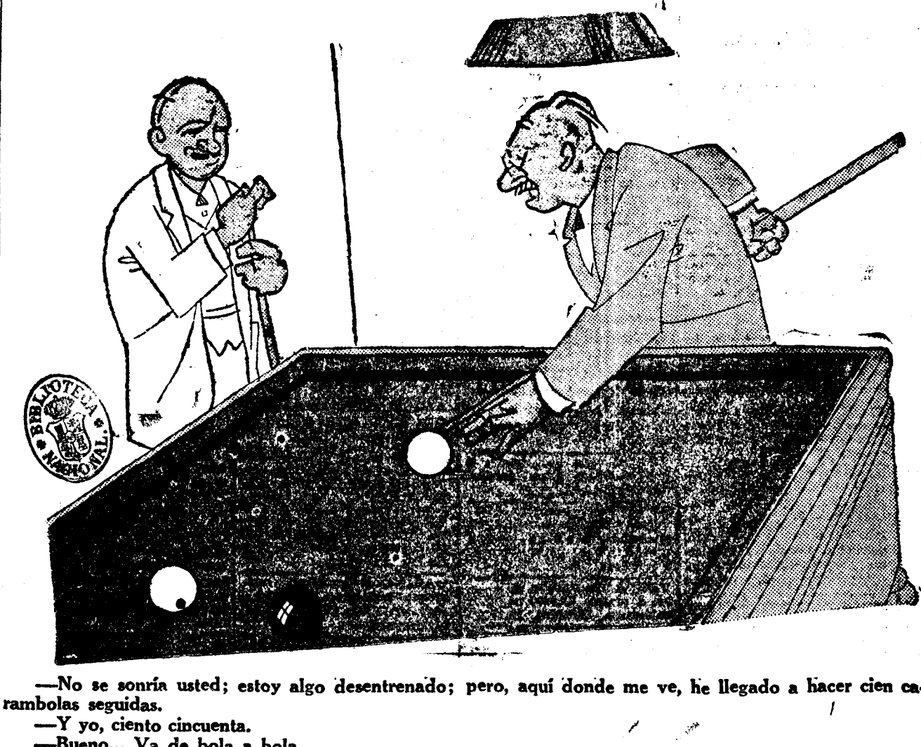
—No se sonría usted; estoy algo desentrenado; pero, aquí donde me ve, he llegado a hacer cien carambolas seguidas.

—Y yo, ciento cincuenta. —Bueno... Va de bola a bola.