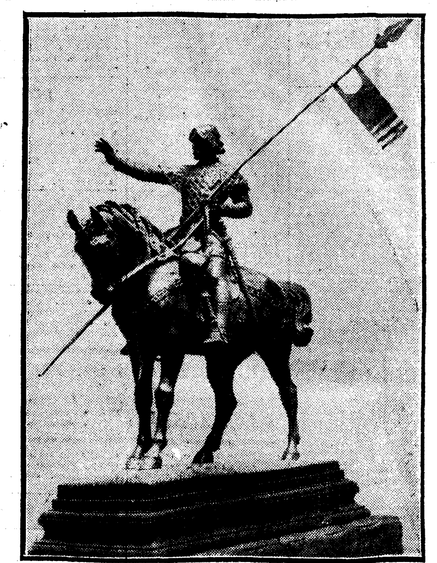
Estatua de San Wenceslao, en Praga. Las fiestas milenarias se están celebrando actualmente con gran brillantez.

ESTOCOLMO, 28.—La Policía ha efectuado la detención de un ciudadano ruso, miembro del Komintern, en un viaje a Suecia para vigilar a los caudillos comunistas de este país.