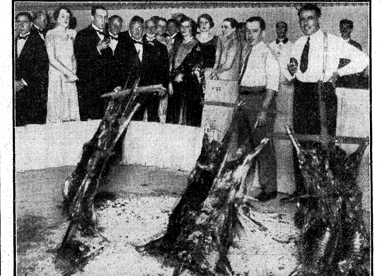
Las autoridades y los invitados presenciando el asado a la criolla en el Pabellón Argentino de la Exposición de Sevilla.

La fachada de la Basílica de Nuestra Señora de los Ermitaños, de aspecto severo, a pesar de sus ventanales, rososones y estatuas, y de proporciones gigantescas, es una verdadera maravilla, que nos recuerda otra que tenemos en España: El Escorial.