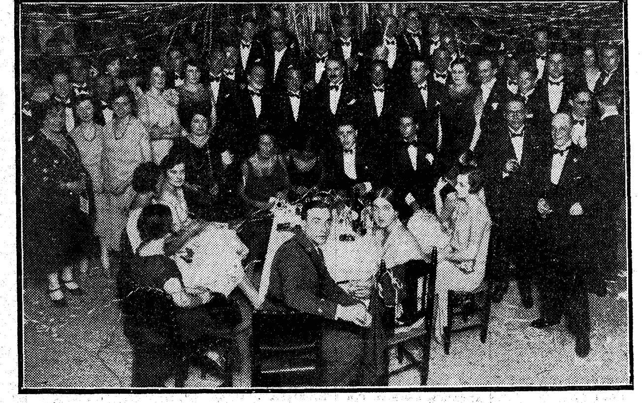
Un aspecto de la fiesta que celebró en honor de la buena sociedad sevillana la Delegación del Pabellón Argentino.