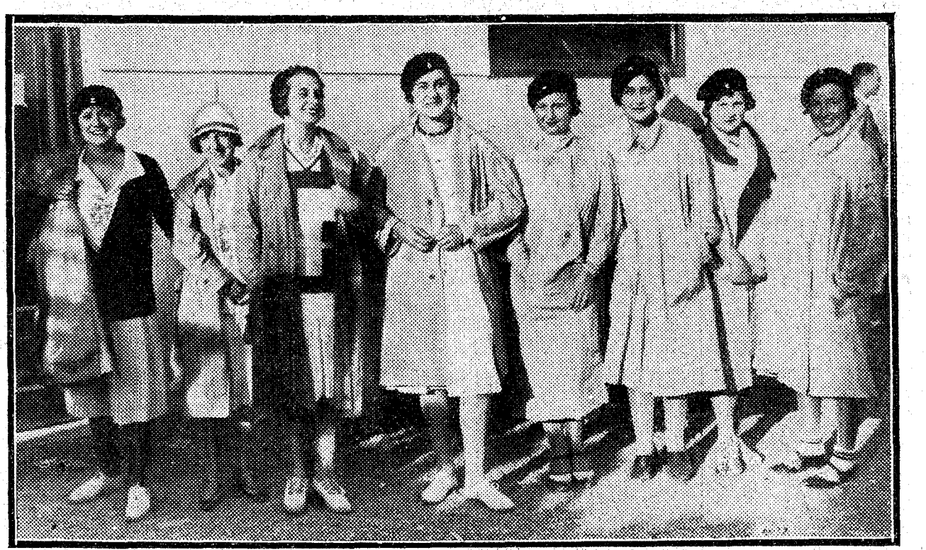
Algunas de las señoritas de Vigo, Villagarcía y La Coruña que participaron en la regata de baltros patroneados por el bello sexo.

Las autoridades y los invitados presenciando el asado a la criolla en el Pabellón Argentino de la Exposición de Sevilla.