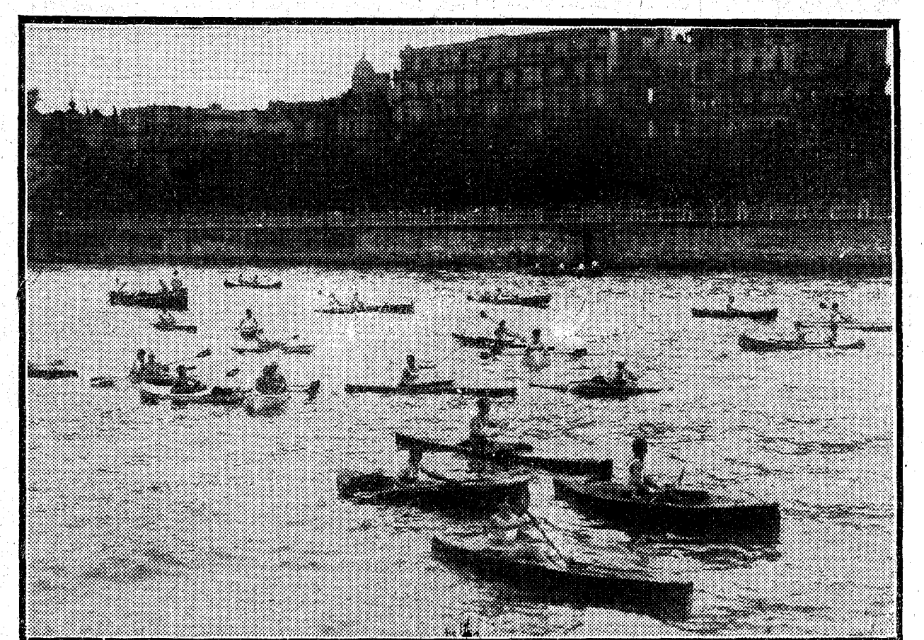
Un interesante momento del campeonato guipuzcoano de piraguas.