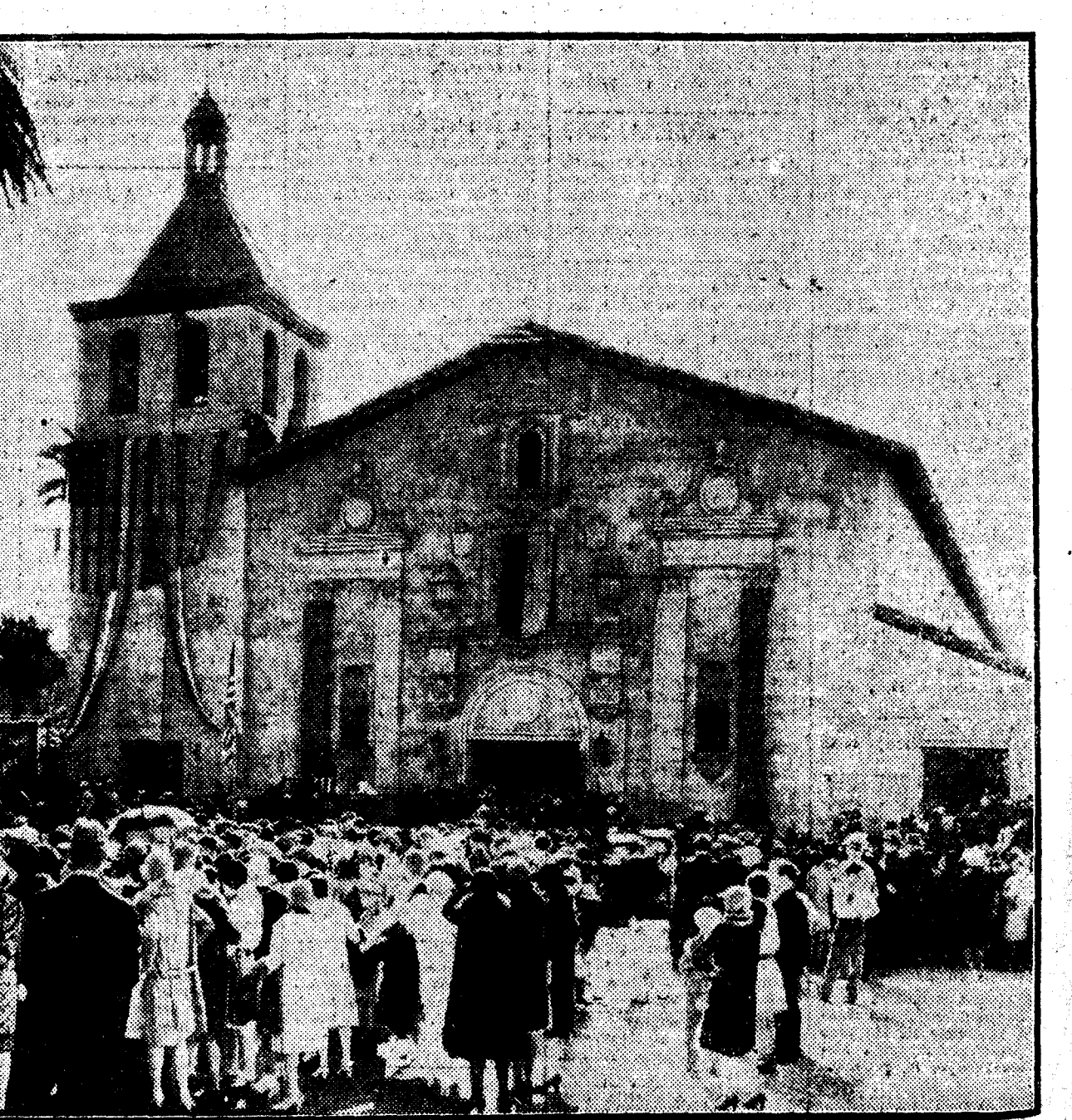
Desde 1798 la hermosa iglesia de Santa Clara de California lució las campanas que le regaló Carlos III. No hace muchos años, una de ellas se quebró y quedó inutilizada. Enterado don Alfonso XIII, regaló una nueva a la iglesia. La foto representa la inauguración de la campana, que tuvo lugar el día de la Fiesta de la Raza. Una enorme multitud, en la que aparecen estandaristas de la Sociedad Española y de la Universidad de Santa Clara, presenció el acto, que fué, por su brillantez y el entusiasmo de los que en él participaron, una demostración sincera de gratitud y de amor a España.