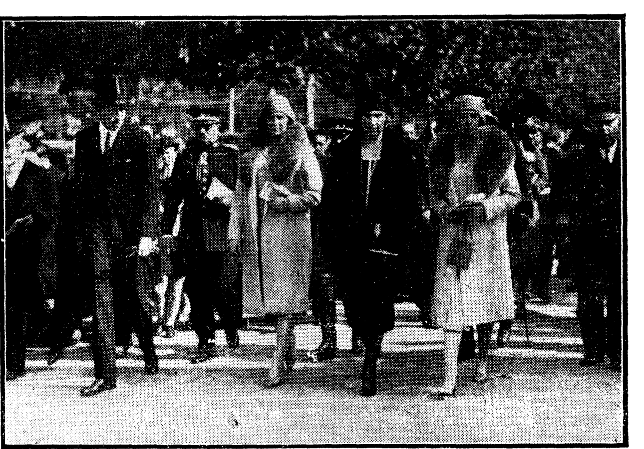
Su majestad la Reina, las infantas doña Beatriz y doña Cristina y el infante don Jaime, paseando a pie por el sector Sur de la Exposición Iberoamericana, seguidos del numeroso público que los vitoreó