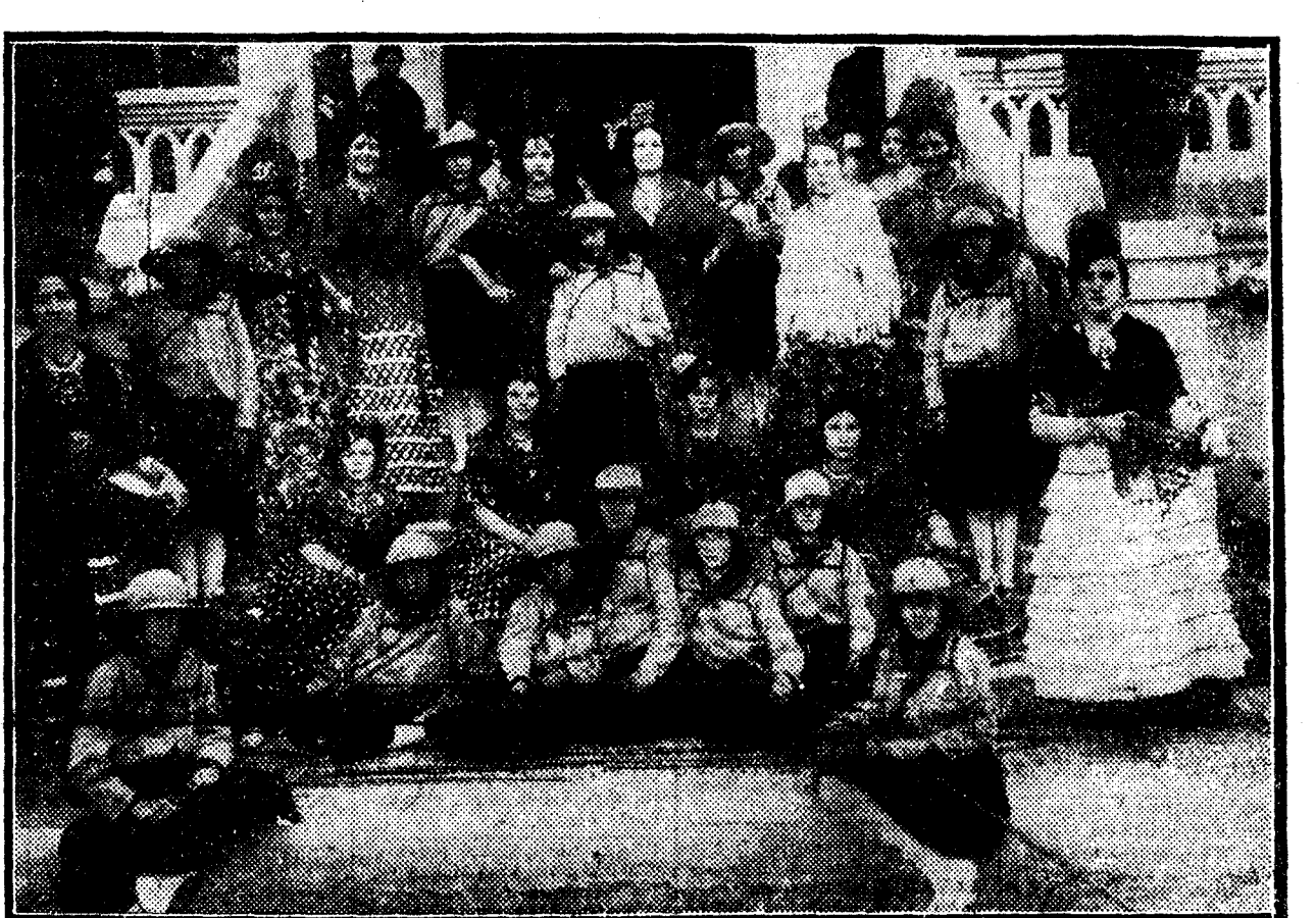
Grupo de algunas de las distinguidas señoritas que asistieron a las fiestas calasancias, celebradas en la sierra de Córdoba