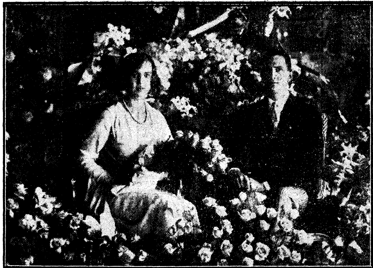
Primera fotografía obtenida de la princesa María José de Bélgica con su prometido, el Príncipe heredero de Italia, después de haber firmado sus esponsales en el Real Palacio de Laeken

Varsovia, 27.—Según el "Kurjer Czerwony", un miembro de la Legación soviética en Varsovia ha sido reconocido como culpable de espionaje, intentando sobornar a un oficial de Caballería, en situación de disponibilidad.