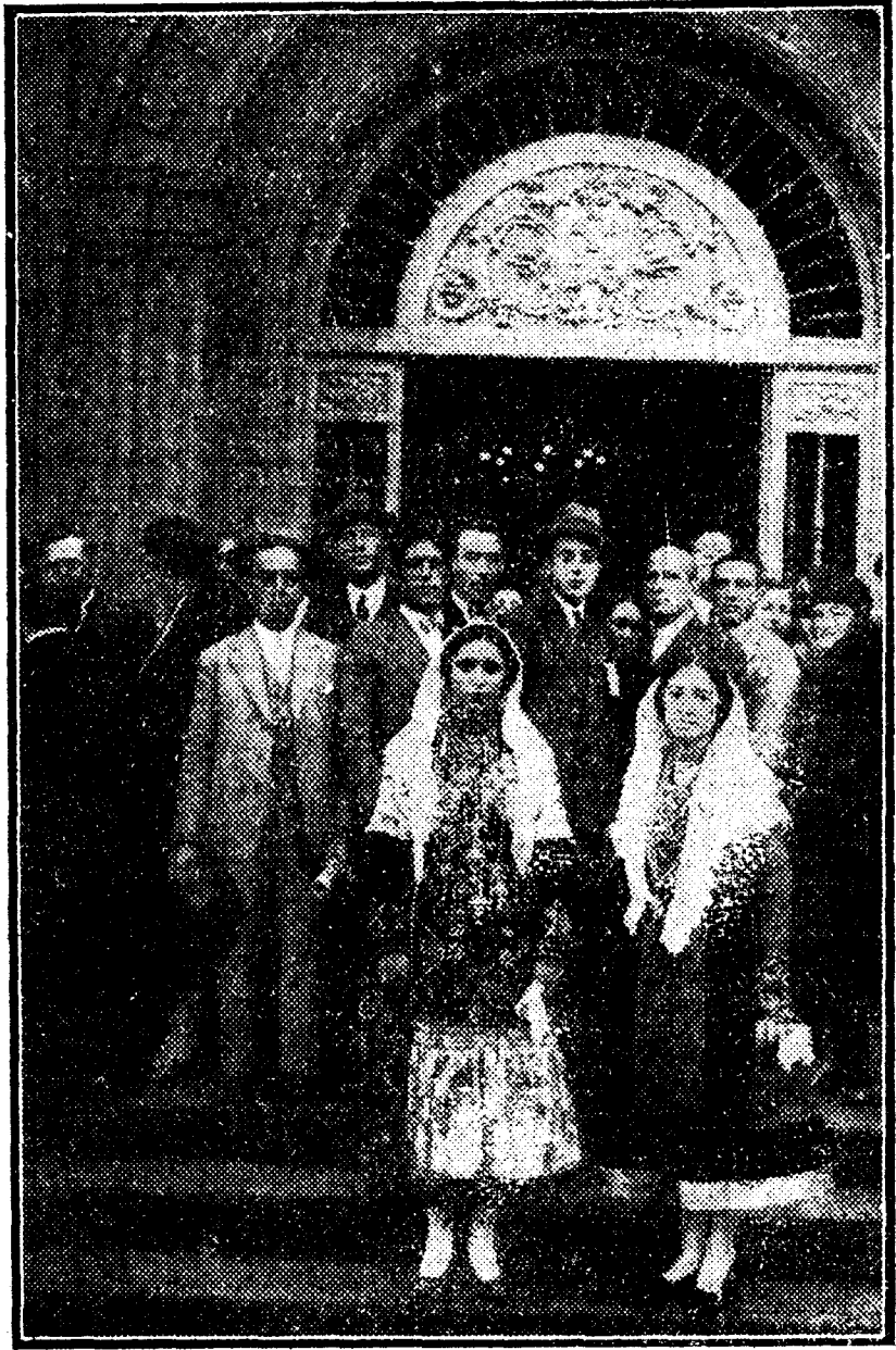
Señoritas vistiendo el traje típico de León y Castilla en la puerta del mismo pabellón en la Exposición Iberoamericana

Curioso personaje fué Erik Satie. A la aureola que se le hizo como precursor de Debussy se unía el humorismo en frío, el cual, más que en su música propiamente dicha, se exteriorizaba en los títulos de sus obras, hechos con un gracejo sutil e irónico verdaderamente original.