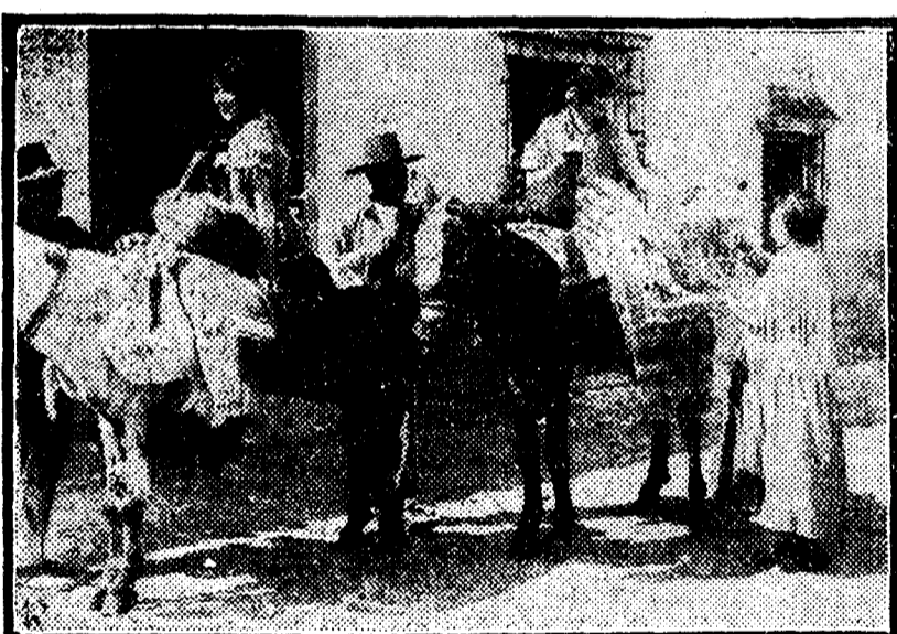
Una escena de la película "La copia andaluza", dirigida por Ernesto González, que se estrenará muy en breve.

EL DEBATE: "De igual manera que en "Sansón" y en "Los diez mandamientos", la base de "El Arca de Noé" es un asunto vivido doblemente, en época actual y en los tiempos bíblicos. Hay, con todo, en esta última, algo que le da profundidad y valor ejemplar: un paralelo entre las abominaciones y crímenes que provocaron el diluvio y el culto al dinero, el afán de placeres y el sensualismo actual. Frente a la adoración al becerro de oro, la bolsa; frente a la torre de Babel, las torres de los buildings; como consecuencia, un reconocimiento de la justicia divina, que, lo mismo que envió el diluvio, permite que se desencadenen la guerra. No está mal este recuerdo de la omnipotencia divina y el hacer que la gente piense en Dios." "A B C": "El Arca de Noé" es un espectáculo maravilloso. Por haberlo dado a conocer, la Empresa del Callao recibió muchas felicitaciones." "El Sol": "El público vió y escuchó el "film" con entusiasmo auténtico. Y el "cine" del Callao tiene película para largo tiempo. "Heraldo": "En suma, un éxito grande y definitivo."