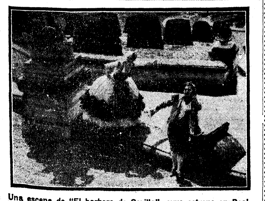
Una escena de "El barbero de Sevilla", cuyo estreno en Real Cinema ha constituido un éxito definitivo.

(MARCA RENACIMIENTO) EN REAL CINEMA Partitura especial adaptada para sincronización en aparatos de "cine" sonoro, a base de "El barbero de Sevilla", "Las bodas de Figaro" y canciones por CONCHITA SUPERVIA MARCOS REDONDO TITTO SCHIPA y el gran bajo ruso CHALIAPIN