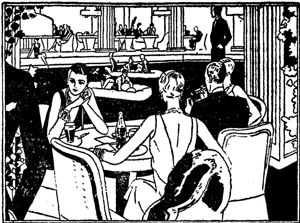
Saborear un vaso de Coca-Cola es un deleite del que no saben prescindir los paladares refinados

En aquellos lugares más elegantes de Europa la bebida favorita por su sabor delicioso y su aroma incomparable