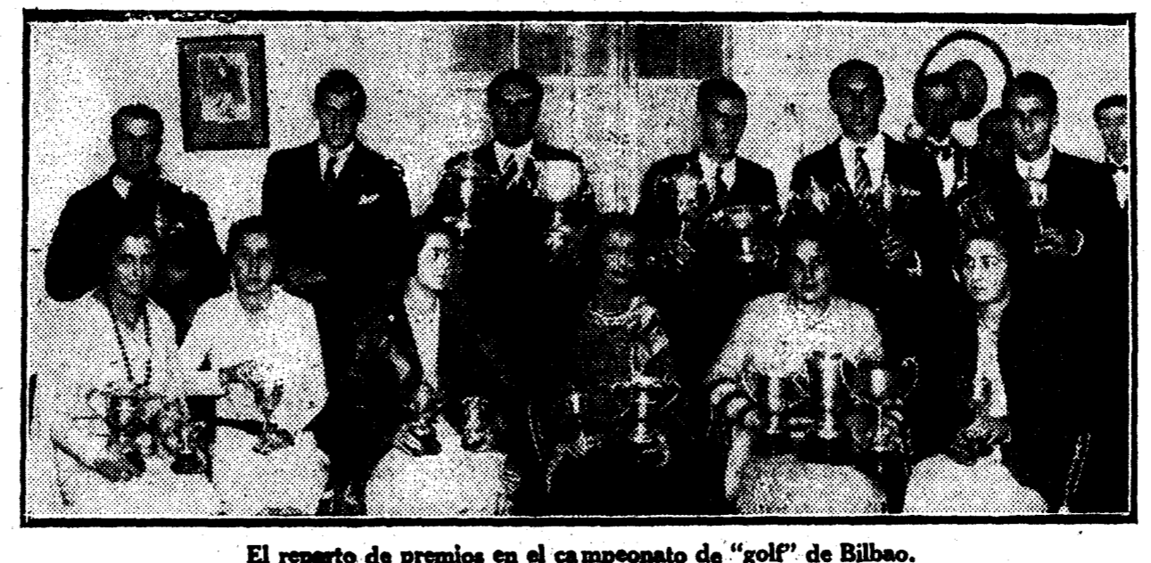
El reparto de premios en el campeonato de "golf" de Bilbao.