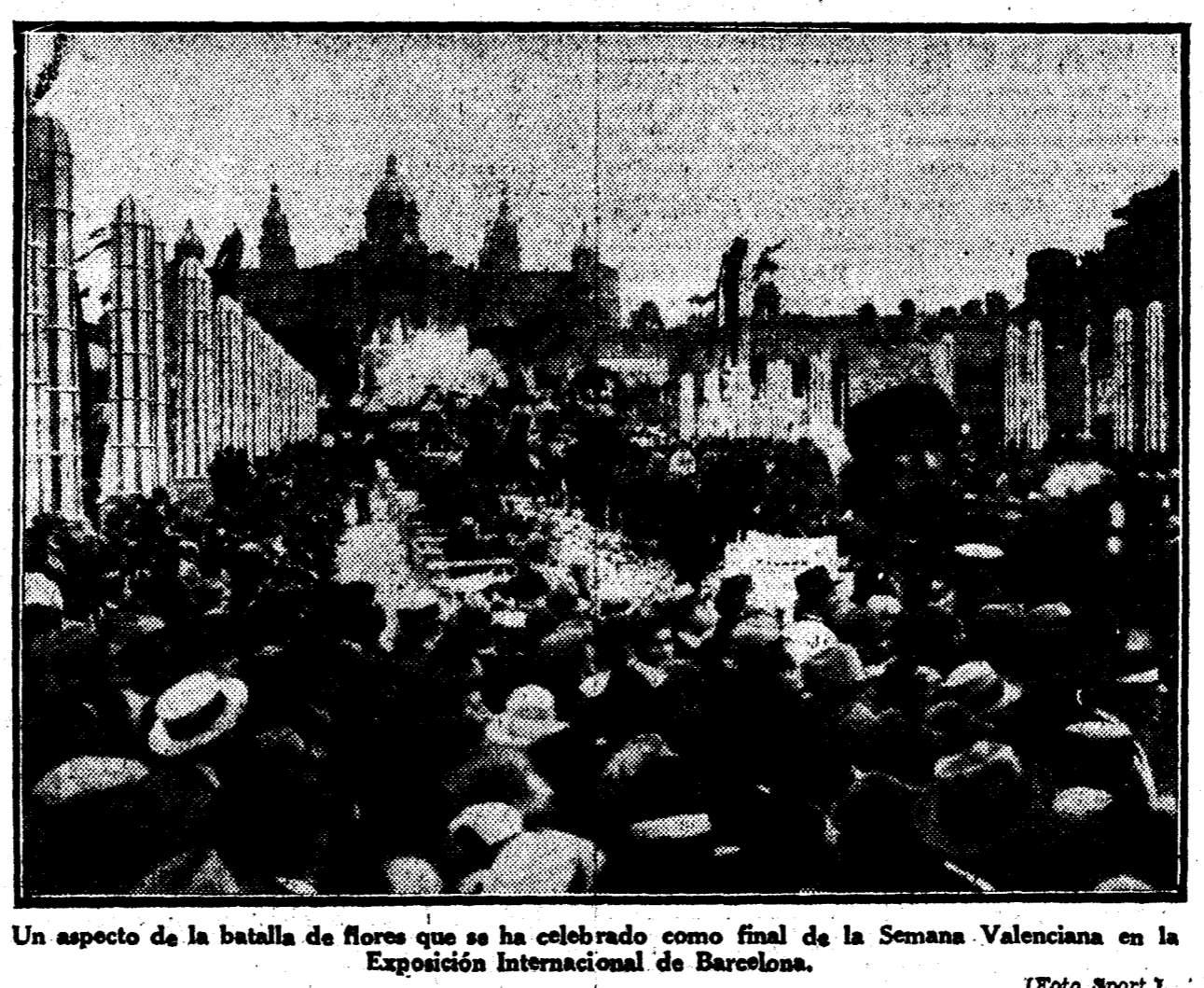
Un aspecto de la batalla de flores que se ha celebrado como final de la Semana Valenciana en la Exposición Internacional de Barcelona.

CHINITAS Académico de la R. de S. Fernando... "Vendian un producto a menos precio que su fabricante..."