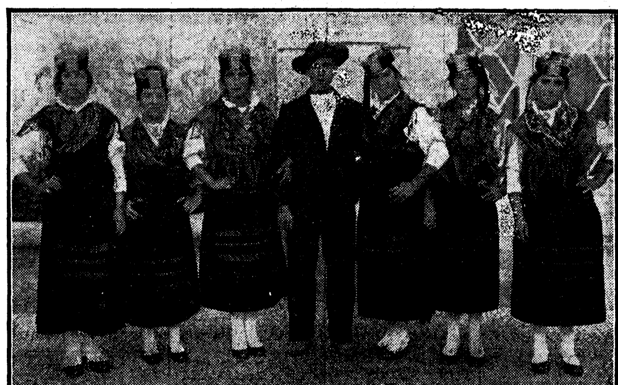
Aldeanos portugueses que han ido a Sevilla con motivo de la celebración de la Semana de Portugal...