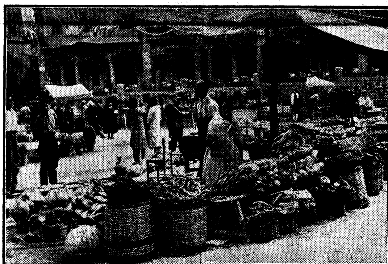
Una de las típicas tiendas del Pueblo Español, de la Exposición de Barcelona, durante la celebra- ción de la Semana Aragonesa.