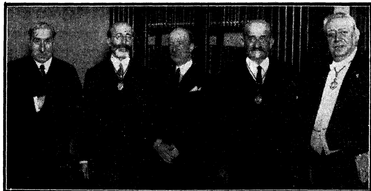
El ministro de Instrucción pública, señor Callejo, que ha presidido la sesión celebrada en la Real Academia Española...