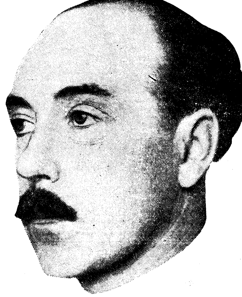
El notable físico francés William Loth, que ha realizado unos interesantes experimentos sobre la navegación física.

El descubrimiento de Loth, aun no llevado profusamente al campo de la práctica, es de una extraordinaria importancia en el mundo científico. Mediante rutas que tracen en el aire o en el mar las ondas hertzianas, se establece la posibilidad de evitar los choques entre navíos o entre aviones a causa de niebla o bruma y de facilitar el aterrizaje a estos últimos. El nuevo sistema honra a su autor y viene a reemplazar al procedimiento de las campanas y sirenas para las embarcaciones. Así parecen comprobarlo las últimas experiencias realizadas ante el ministro del Aire, M. Eynac, en la isla Vaux del Sena.