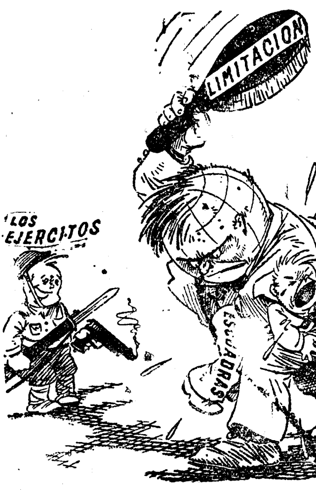
BUENO; Y AL OTRO, ¿POR QUE NO? ("Brooklyn Times").