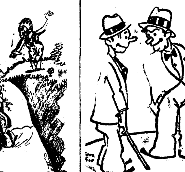
—¿Imbécil! ¡Si dejas caer la sombrilla y la cesta te hago migas!