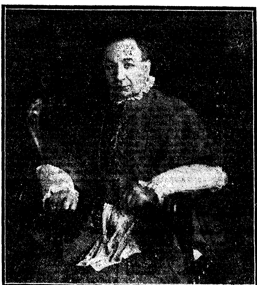
El Arzobispo de Valencia, que presidió ayer la sesión de la sección femenina

Los jóvenes obreros tienen como enemigo la organización industrial y económica, esa organización industrial y económica actual, la sociedad anónima que se convierte a veces en entidad jurídica sin entrañas. No saben los directores y los consejeros de esa sociedad anónima que a ellos les toca realizar la labor que el padre de familia realiza con sus hijos o el jefe de una casa en la sociedad civil.