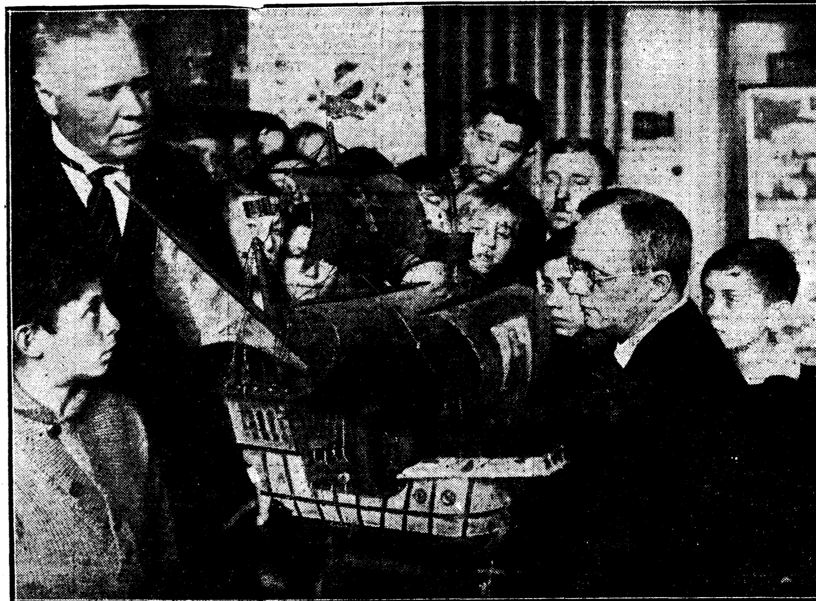
Una reproducción de la carabela "Santa María", que se encuentra en el Museo Escolar de Berlín y que está siendo visitada por todos los escolares, a los que interesa extraordinariamente.