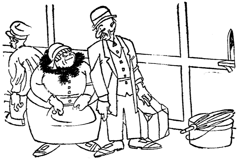
—Bueno, entendámonos, Angelines; entonces un billete de segunda para mí y tú en doble pequeña.