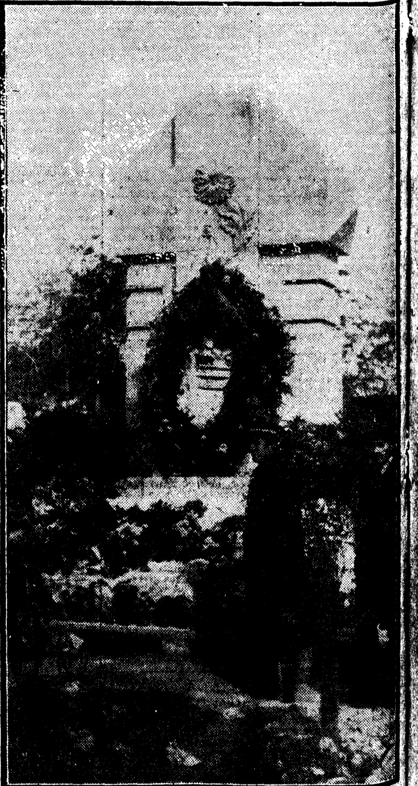
Monumento erigido a la memoria de las víctimas del incendio de Novedades

GRAN VIA, 8. Fijarse bien: CONDE DE PEÑALVER Fernando VI, 17 Sevilla, 16