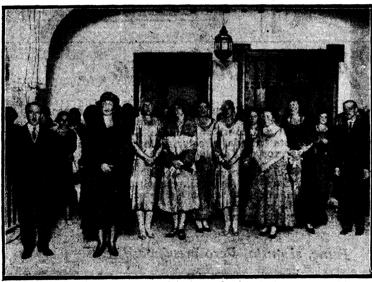
Su majestad la Reina y las infantas doña Beatriz y doña Cristina, acompañadas de la infanta doña María Luisa...