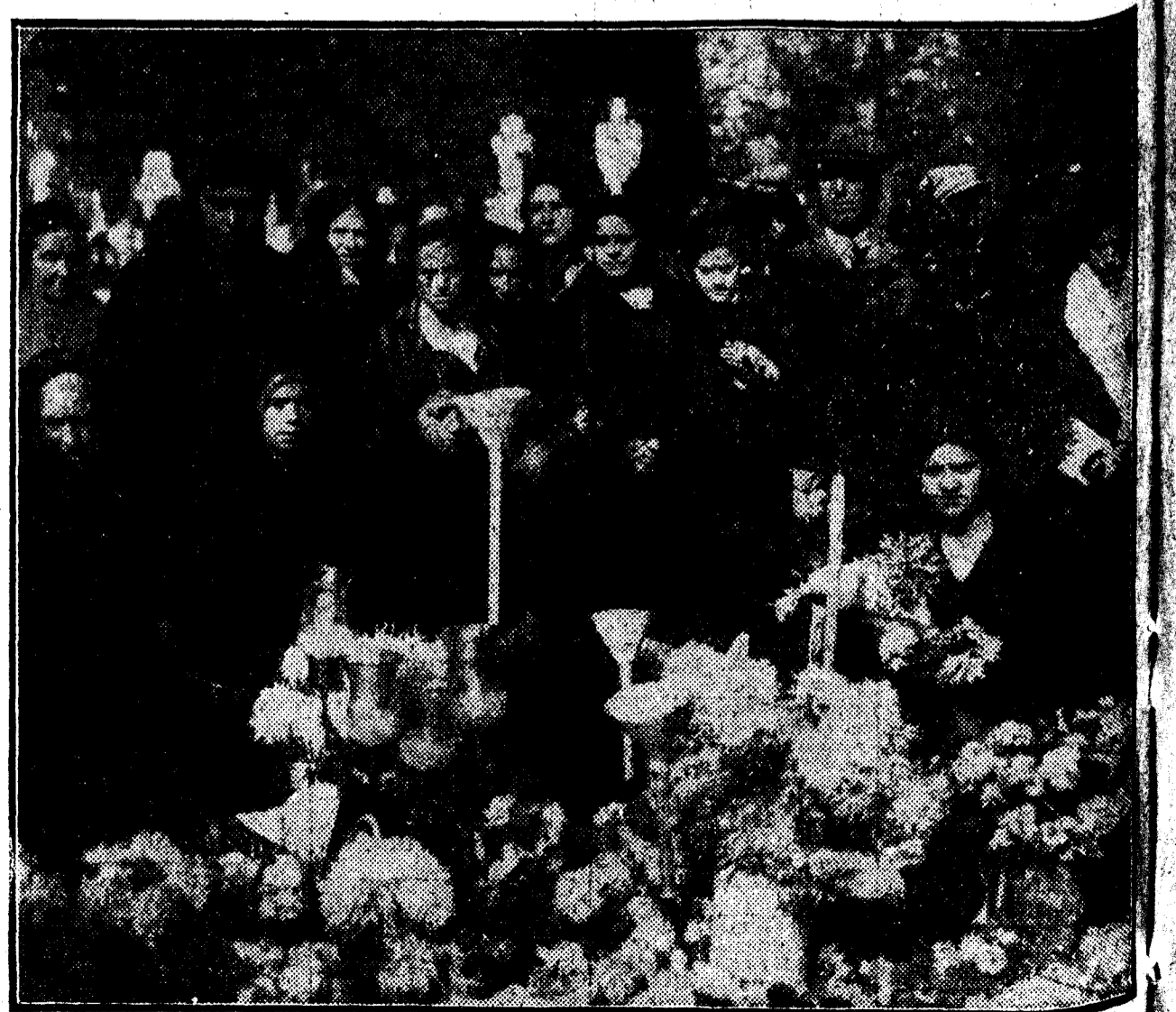
Familiares de las víctimas del incendio de Novedades, cuyas tumbas han cubierto de flores