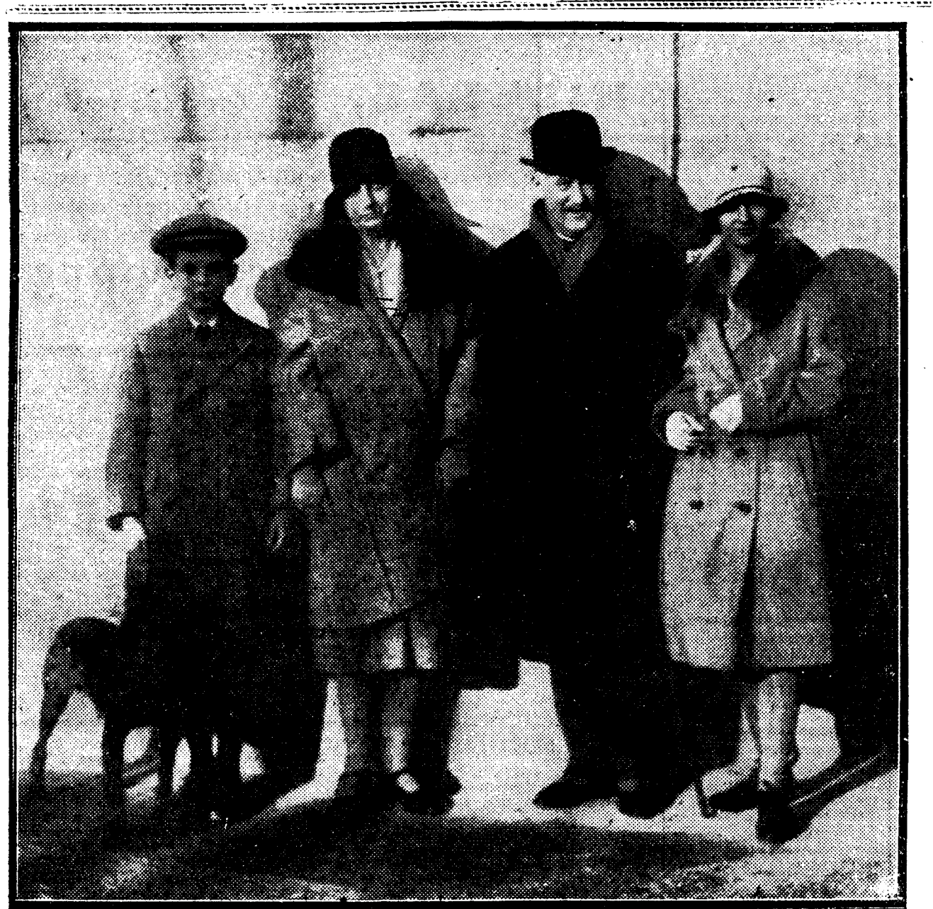
El nuevo embajador de los Estados Unidos en España, Mr. Laughlin, con su esposa e hijos, fotografiados en la Embajada norteamericana a su llegada a Madrid en la mañana de ayer