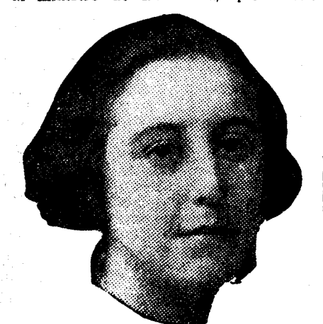
La duquesa de Algeciras