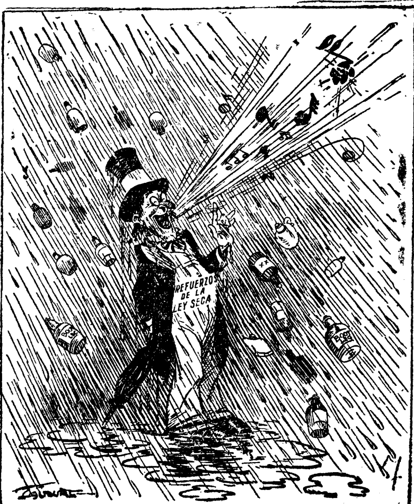
CUANTO MAS CANTA, MAS LUEVE ("New York Telegram.")