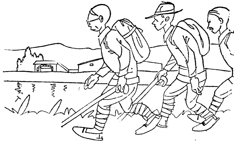
—Ahora ya todo el camino río adelante. ¡Ah! Y mucho cuidado con perder el curso.