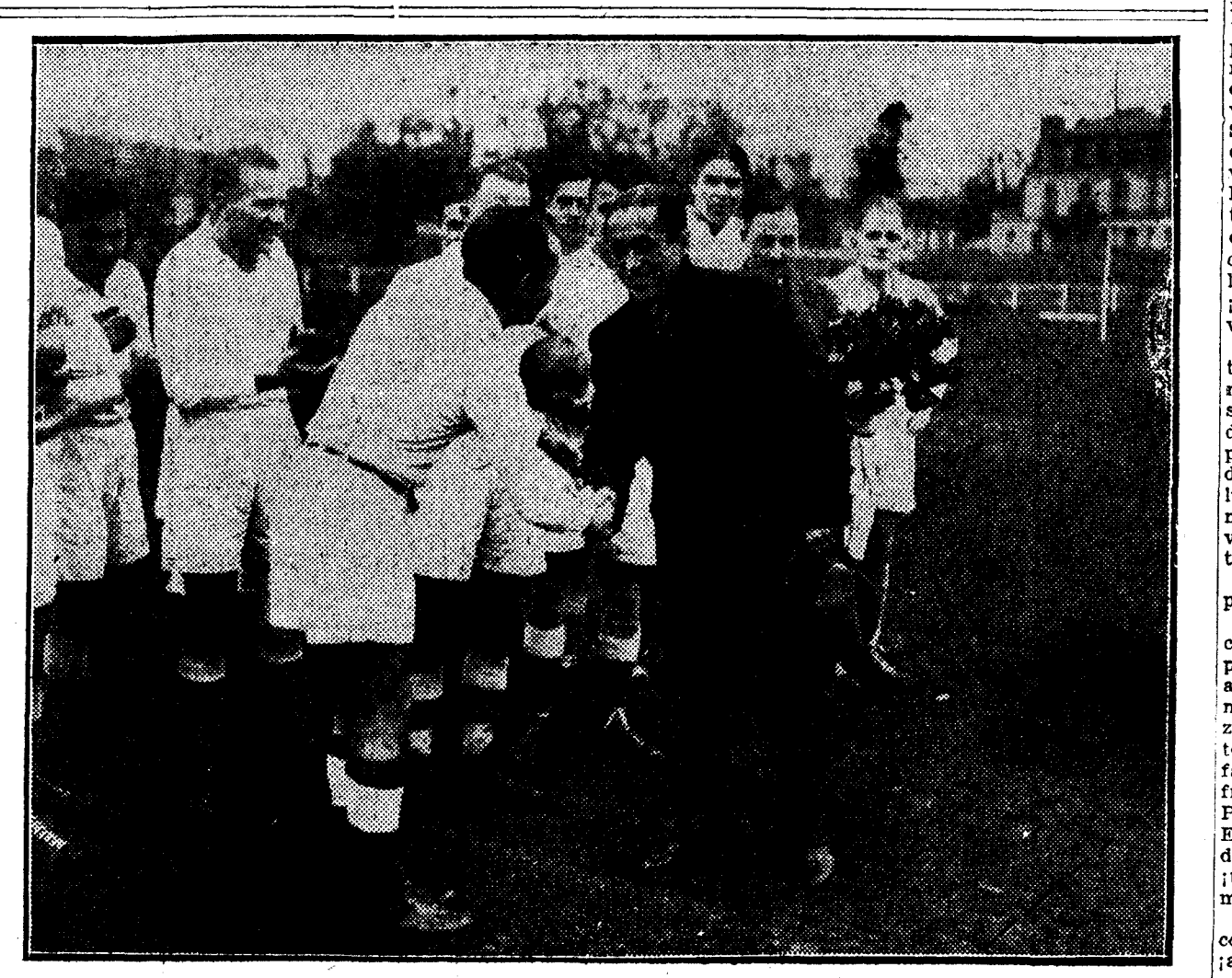
Antes de celebrarse el "match" internacional de "rugby" entre Francia y Alemania, en el cual los franceses resultaron vencedores, el aviador Costes saluda al capitán del equipo germano.