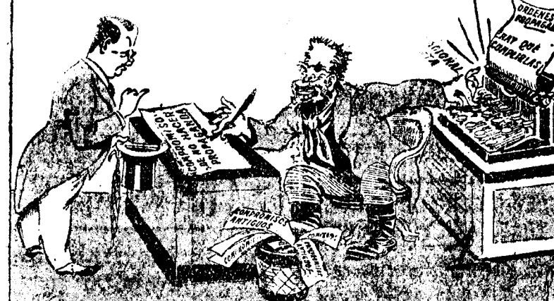
El bolchevista es ambidiestro. Puede utilizar con la misma soltura las dos manos

Contrabando de relojes suizos en EE. UU.