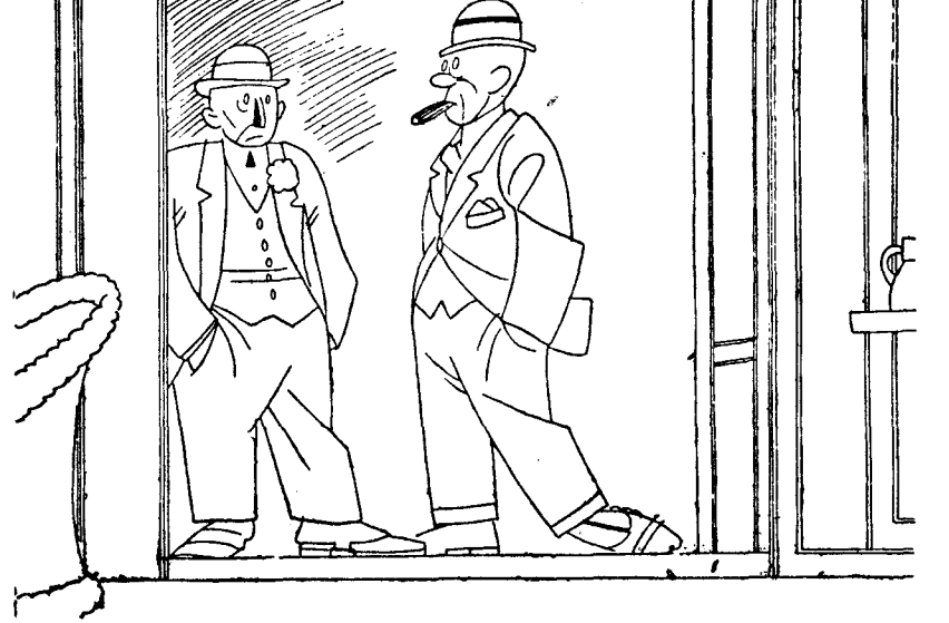
—Pues nosotros acabamos de representar "La Gran Vía" en provincias y no nos dejaron cantar lo de: "Soy el rata primero, y yo el segundo, y yo el tercero". —Claro; la campaña de desratización.