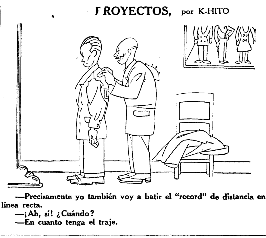
—Precisamente yo también voy a batir el "record" de distancia en línea recta.

—Ah, sí! ¿Cuándo? —En cuanto tenga el traje.