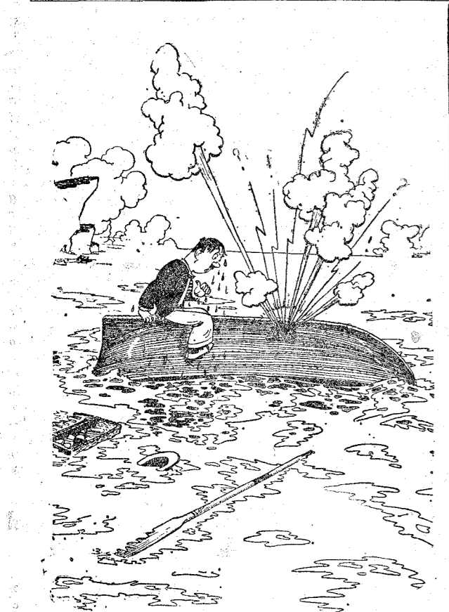
—Ten un poquito de paciencia, mujer. Todo será ya cuestión de media hora, porque ya nos han visto desde la playa y vienen a salvarnos. (The Passing Show, Londres.)