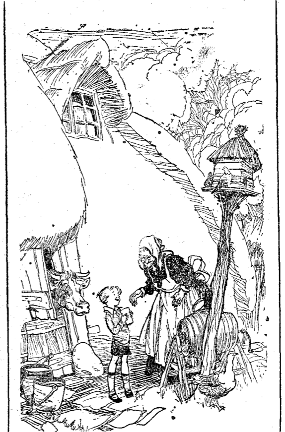
EL CHICO (que ha ido al campo por primera vez en su vida).—Qué buena es esta leche; ¡es lástima que nuestro lechero no tenga también vacas! (London Opinion, Londres.)