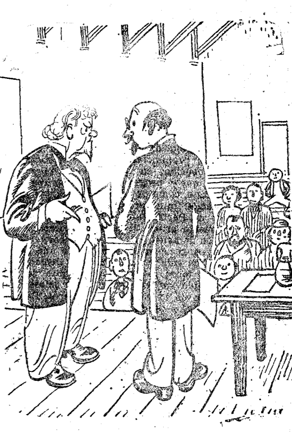
EL CONFERENCIANTE (viendo que el auditorio no excede de siete personas).—No entiendo cómo ha podido ocurrir esto... siendo la primera vez que he venido aquí. (Tramps of a Scamp.)