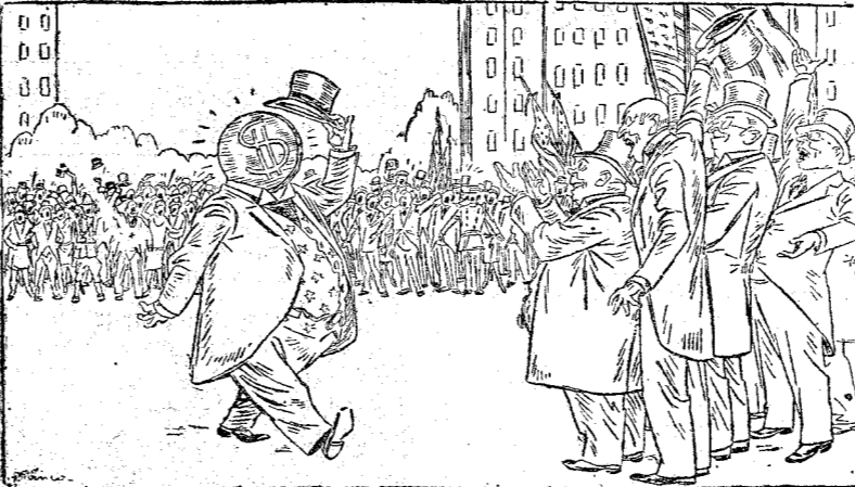
EL DOLAR.—Cualquiera que resulte triunfante, el verdadero presidente será yo.