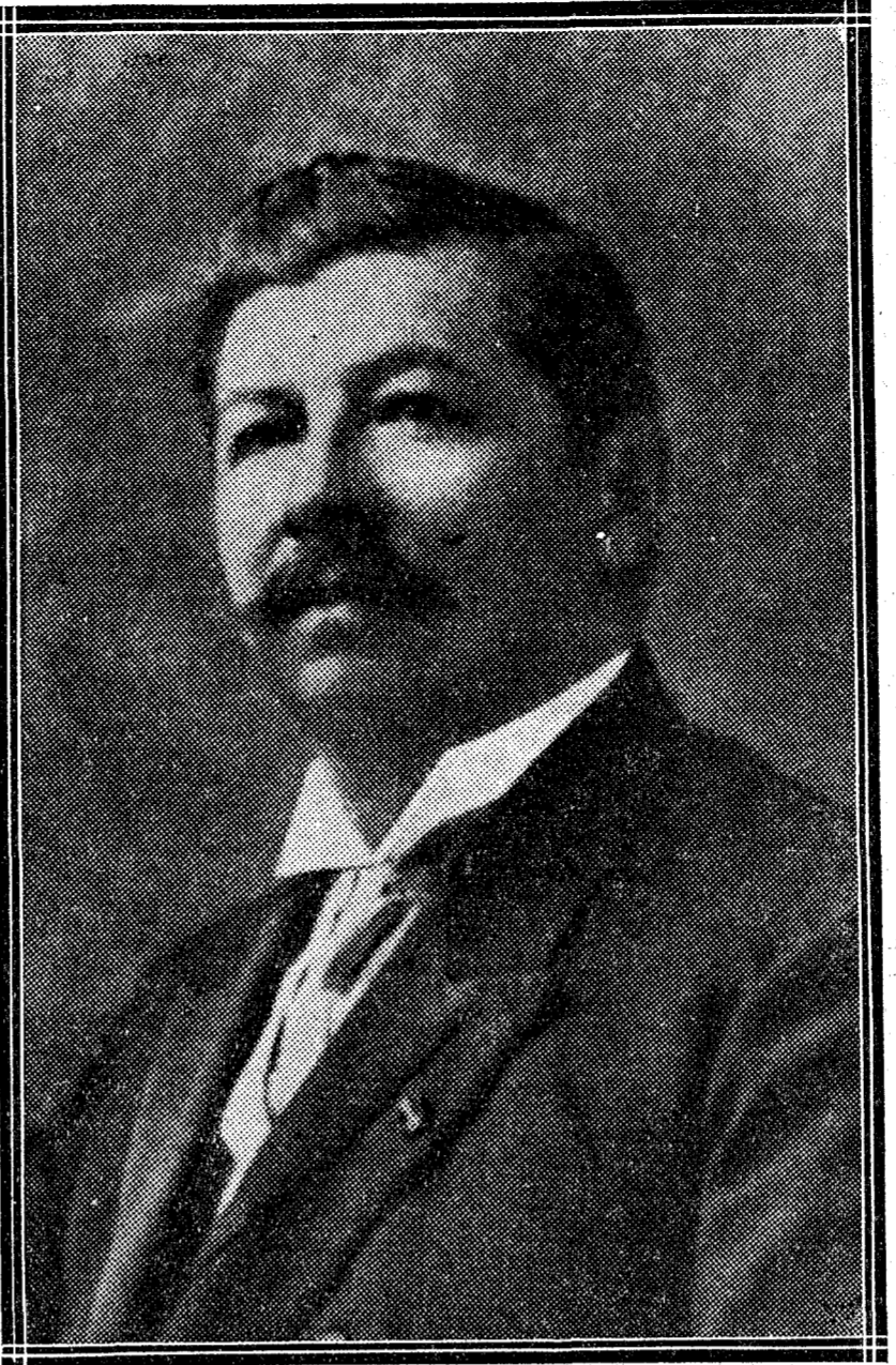
El general Juan Vicente Gómez, presidente de la república de Venezuela, que ha donado vastas extensiones de su propiedad para convertir en puerto libre la magnífica bahía de Turiamo.

El general Gómez tuvo hace tiempo la idea de convertir en puerto libre la bahía de Turiamo, próxima a Puerto Cabello, donde podrán fondear las escuadras más numerosas. La generosa donación que hace en la actualidad corona, al fin, su laudable iniciativa, uno de los más positivos éxitos de su gestión presidencial en el mandato de 1922 a 1929.