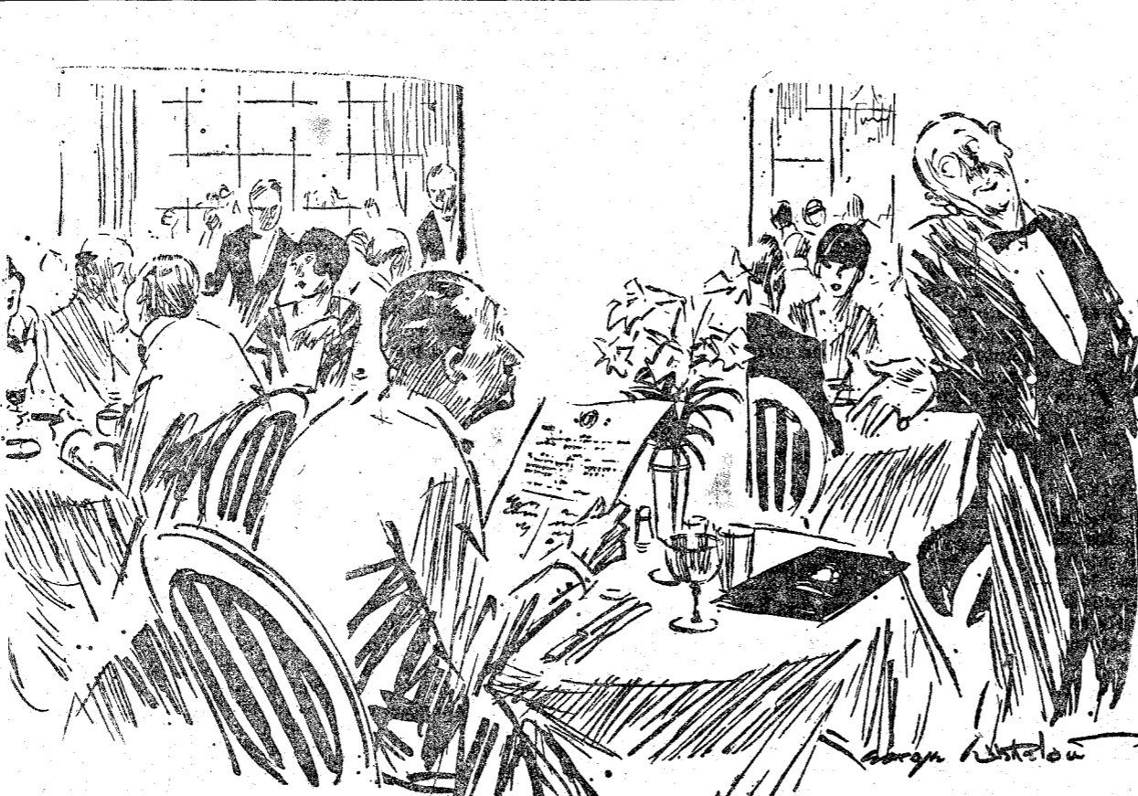
—Camarero, tráigame un pollo muy joven. —Muy bien, señor. Le traeré un huevo. (The Passing Show, Londres.)