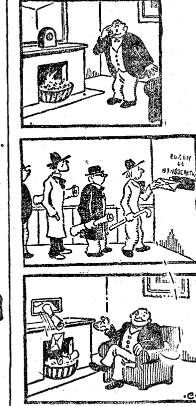
Cómo se las arreglaba un empresario para tener calefacción gratuita. ("Caras y Caretas", Buenos Aires).