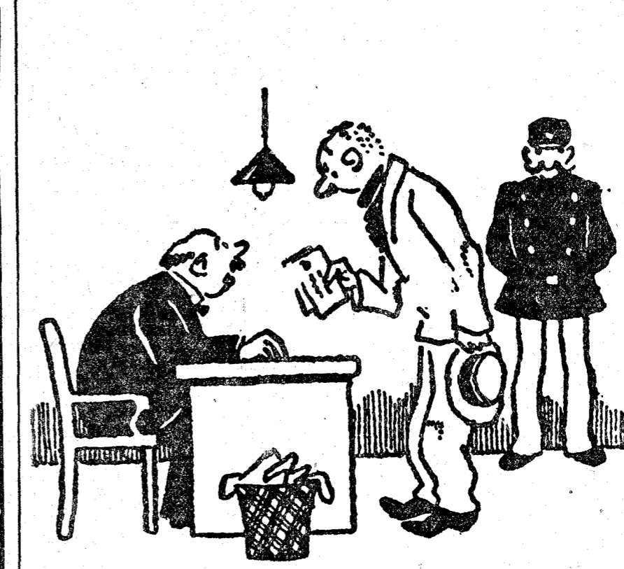
—Entonces, ¿cuál es su domicilio? —Lista de Correos.