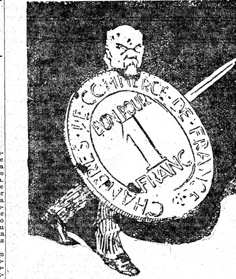
EL FRANCO