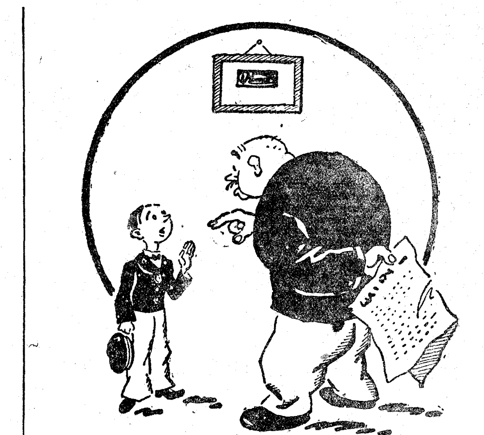
—¿Otra vez suspendido? —Claro. Me han vuelto a preguntar lo mismo que el año pasado. ("Pele Mele", Paris.)