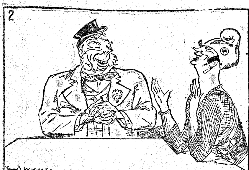
1.—Inglaterra y Francia discuten muy en serio la cuestión cuando Fritz está presente. 2.—...Pero cuando Fritz se va...