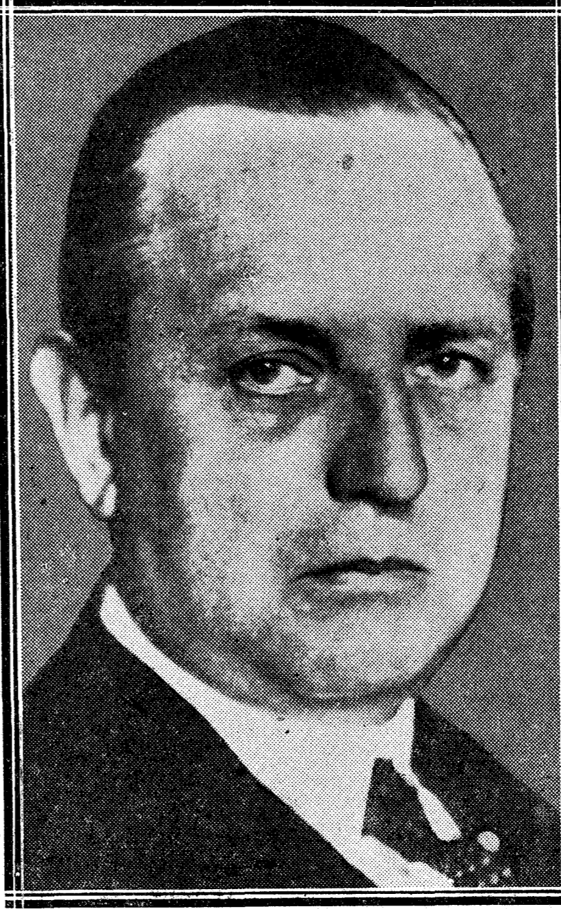
El Sr. Herlut Zahle, delegado de Dinamarca en la Sociedad de Naciones, que ha sido elegido presidente de la Asamblea de la misma.

El Sr. Zahle nació en 1873. Siguió la carrera diplomática, y en 1907 fué secretario de la Conferencia de la Paz en La Haya. Representante de Dinamarca en Estocolmo, Bruselas y Luxemburgo, pasó a Berlín, como ministro plenipotenciario, en 1924, cargo que desempeña en la actualidad. Ha representado a su país en la Asamblea de la Sociedad de Naciones desde 1920, y en esta Sociedad ha pertenecido a las Comisiones de Gastos, de Control y a la consultiva del Opio y otras drogas tóxicas. Últimamente ha sido elegido, por 44 votos de 50 votantes, presidente de la novena Asamblea, que está celebrando actualmente sus sesiones.