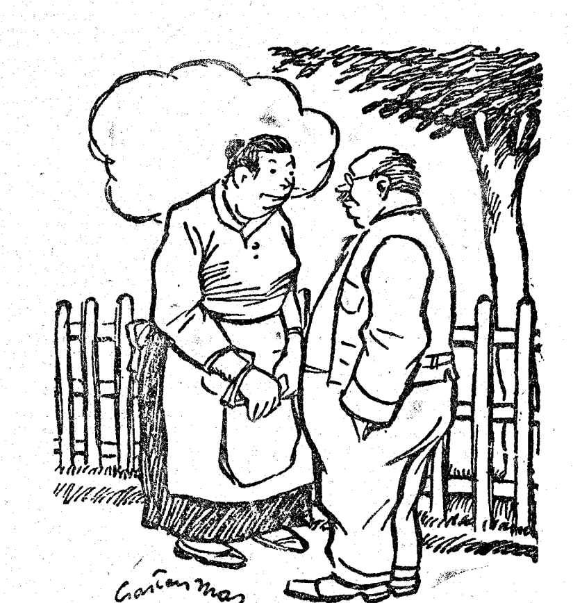
—Mi huésped es filatélico. —¿Qué raro! Yo creí que era español. ("Dimanche Illustré", Paris.)