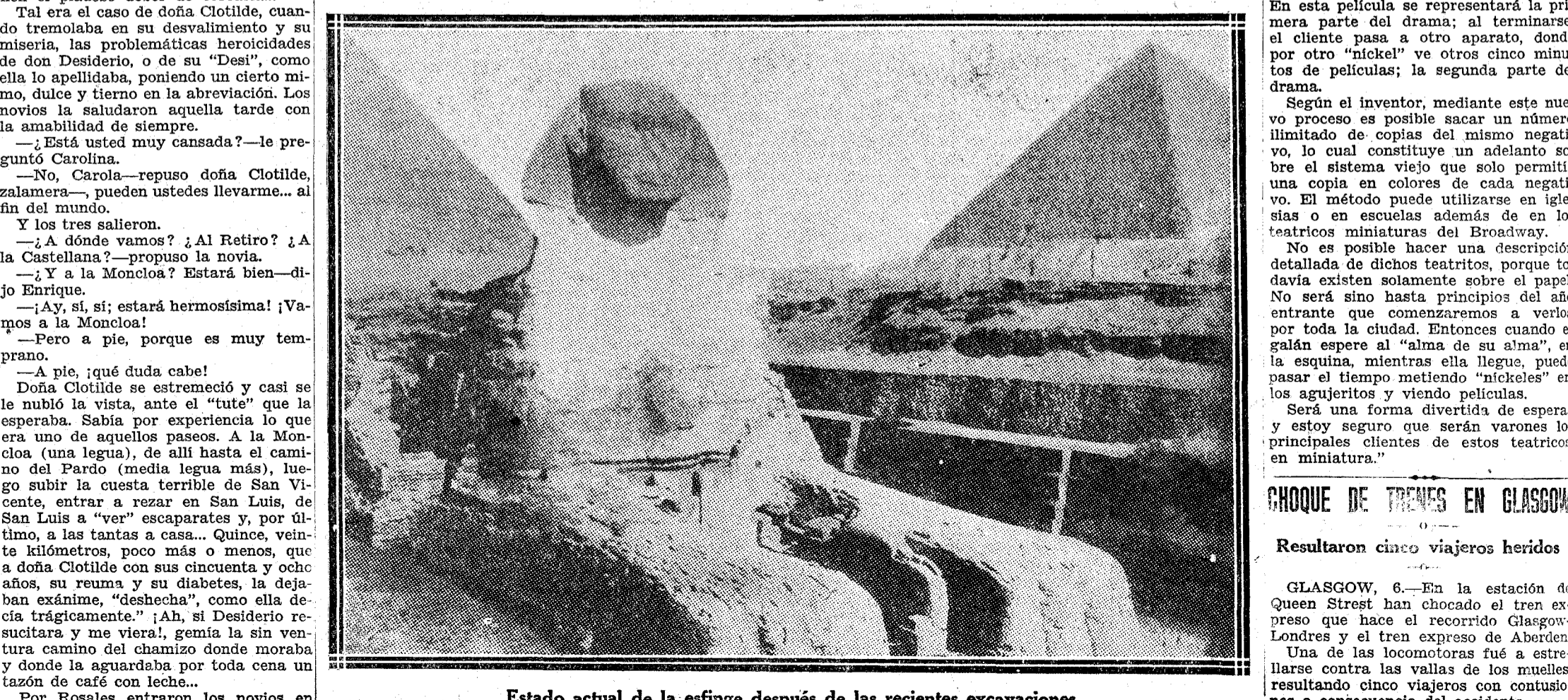
Estado actual de la esfinge después de las recientes excavaciones.

CHERBURGO, 6.—Precedente de los Estados Unidos ha llegado a este puerto la viuda del presidente norteamericano señor Wilson, que se dirige a París y a Ginebra.