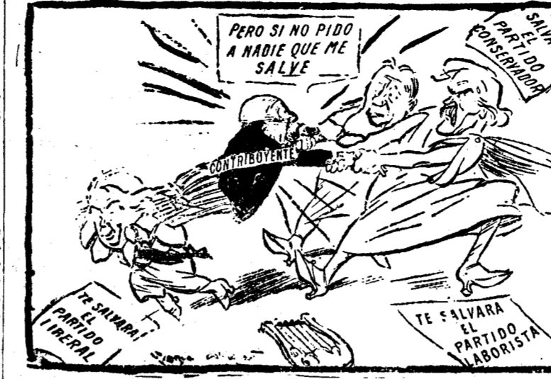
LOS TRES SALVADORES DEL CONTRIBUYENTE INGLÉS ("John Bull", Londres.)