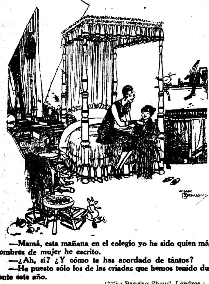
—Mamá, esta mañana en el colegio yo he sido quien más nombres de mujer he escrito. —¿Ah, sí? ¿Y cómo te has acordado de tantos? —Ha puesto sólo los de las criadas que hemos tenido durante este año. ("The Passing Show", Londres)