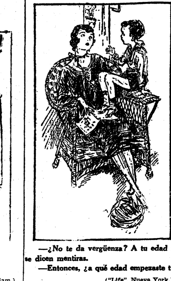
—¿No te da vergüenza? A tu edad no se dicen mentiras. —Entonces, ¿a qué edad empezaste tú? ("Life", Nueva York.)