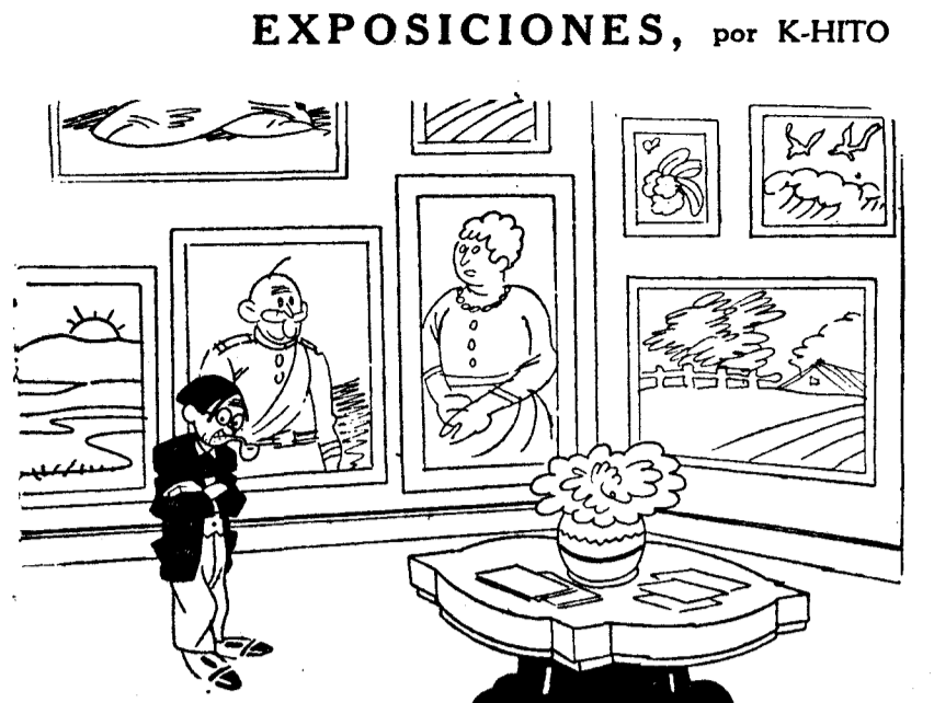
—Pues, señor, ¿dónde leí yo que esta temporada se iban a llevar mucho los cuadros?