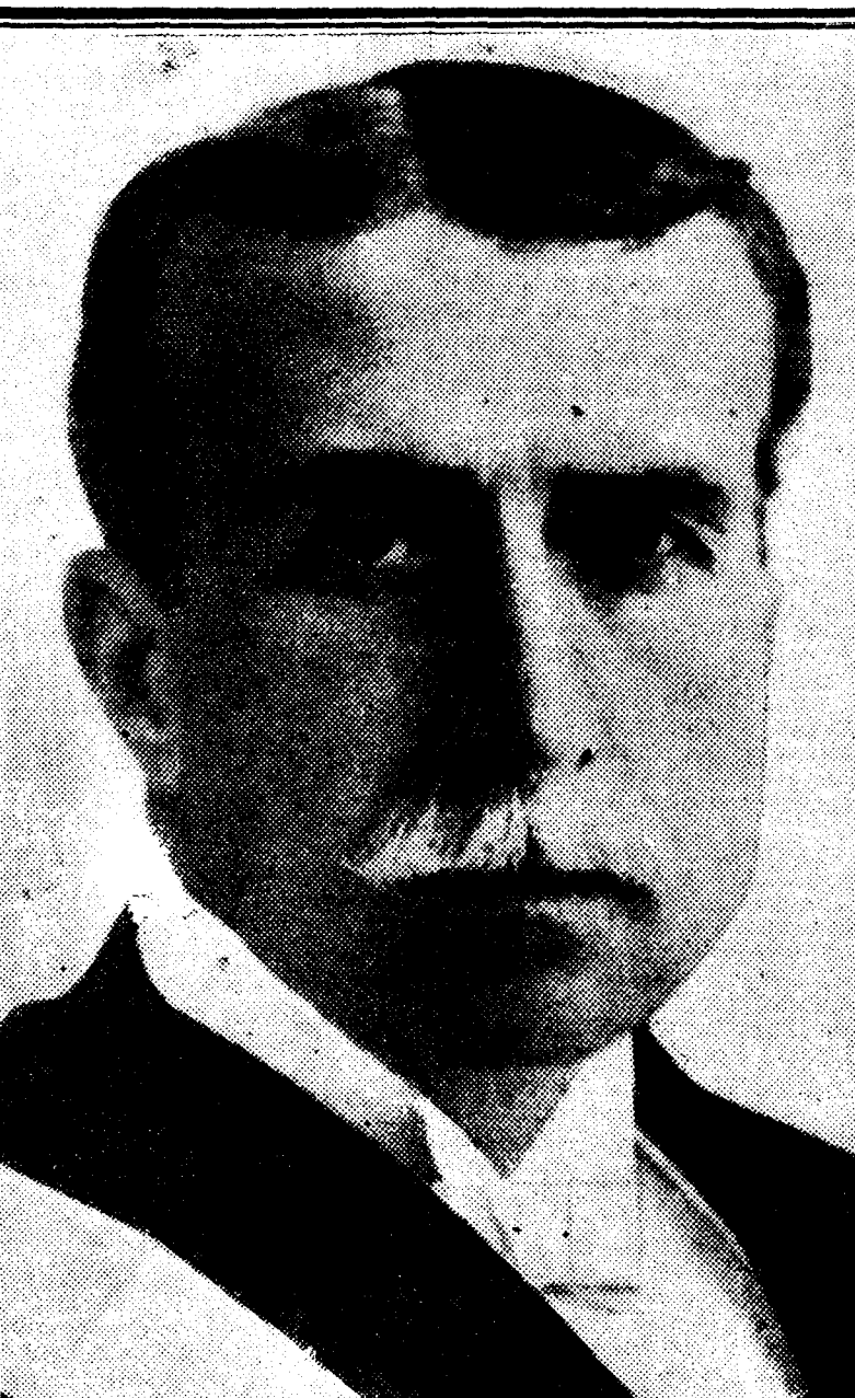
El excelentísimo señor don Augusto B. Leguía, presidente de la república del Perú, a quien se ha levantado un monumento en Lima para conmemorar el 25 aniversario de su vida pública.