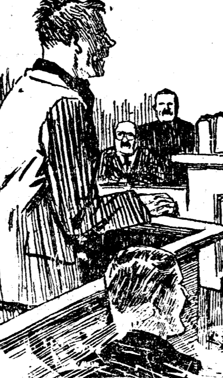
EL JUEZ.—Antes de ser sentenciado, ¿tiene usted algo que exponer? EL ACUSADO.—Me gustaría saber cuál ha sido el resultado de la lucha entre el Athletic y el Racing.