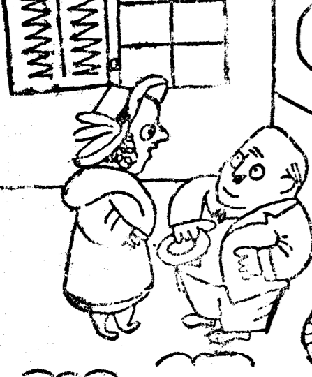
—Todos los días la encuentro a usted más joven. —Es usted demasiado galante. —Bueno, pues ponga usted un día, sí, y un día, no.

LONDRES, 17.—Ha muerto el presidente de la Academia Inglesa de Bellas Artes, sir Frank Dicksee.