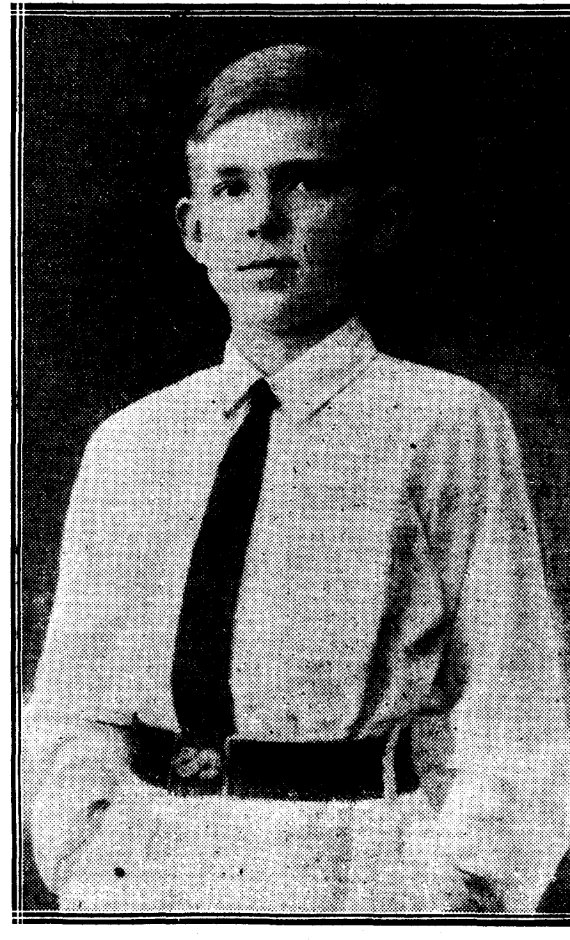
Su alteza real el infante don Juan, a quien su augusto padre dedica a la Marina española

Cuando se halle el tercero de los hijos varones del Rey debidamente preparado, comenzará sus estudios en la Escuela de Marina. Su majestad para dar muestra patente de su cariño a la Armada española, le entrega uno de sus hijos. Gesto noble, bien dentro de una tradición, por desdicha, largo tiempo olvidada. España por los caminos del mar halló los de su fama y gloria en el mundo. Y es consolador y rico en esperanzas el hecho de que un hijo del Monarca español estudie para marino.