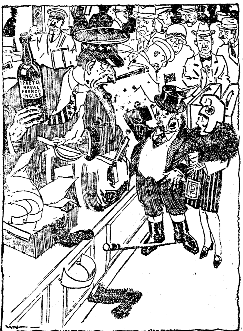
EL TIO SAM.—Yo creo que esto es contrabando.