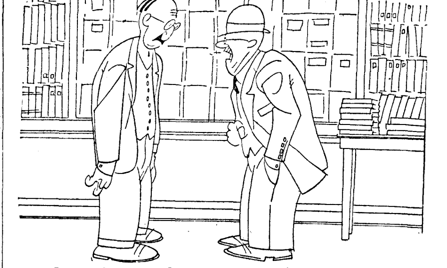
—¿De modo que toda la semana venden los libros con el 10 por 100? —Sí, señor. —Bueno, pues déme usted el libro Diario, el Mayor y el de Caja.