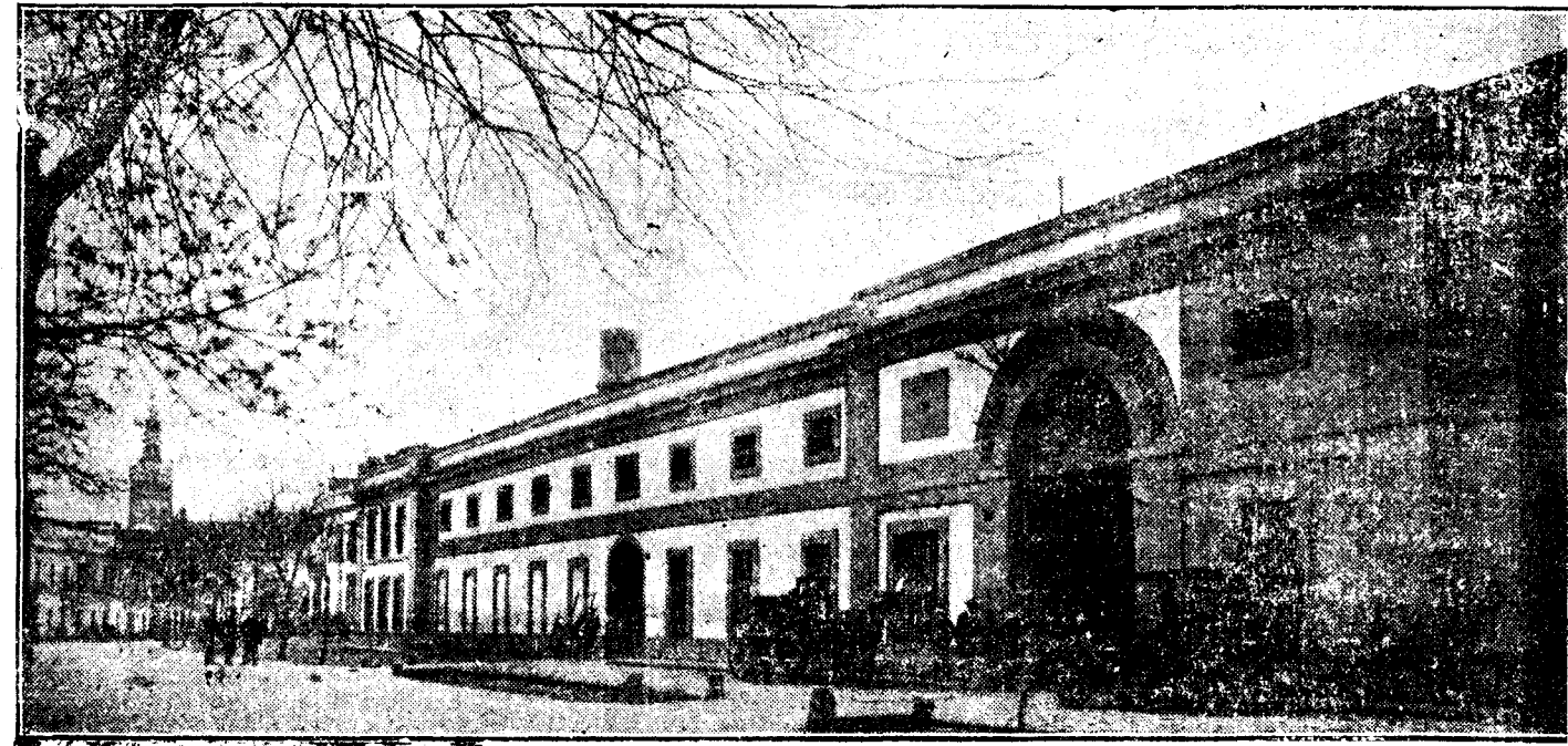
Vista exterior de los almacenes de hierros y maderas de los Hijos de Miguel F. Palacios

Como dice el gran humorista americano no Oliverio W. Holmes, las ideas no son como los sellos de correos, que en usándolos una vez pierden todo su valor. Por eso no me apura repetir, a propósito de los Hijos de Miguel F. Palacios, lo que en otras ocasiones semejantes dije con motivo de empresas industriales análogas por su fuerza, intensidad y crédito a la que ahora me ocupa: «Poner muy alto y muy lejos el ideal, tal vez es airado pretexto para la caída al alcazarle. Acercámonos, aunque se empujue, a nuestros ideales. Fingió la fábula que el águila volaba por llegar al Sol, y en realidad sólo vuela por traer alimento a su nido. Y por eso no se nunca arroja su vuelo.»