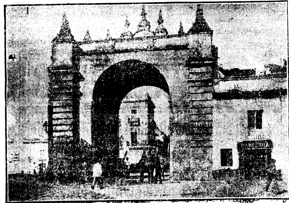
SEVILLA.—Puerta de la Macarena.

Borracho de luz y de belleza, retorno de mi viaje por tierras andaluzas. Vi a la niña gaditana surgiendo de las brumas como sueño de adolescente o como Venus coronada de sol, y destilando sales del cinturón de las Gracias; Huelva, satisfecha con la riqueza de su subsejo; Córdoba, ánora que aún conserva el perfume del extinguido festín; suitana no