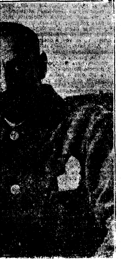
El señor Cambó, que ayer pronunció su conferencia

driguez (don Leonardo), Viguri, Santos Ecay, Llanos Torriglia, Zubiría, Calvo Sotelo, Bertán y Musitu, Albañil, Llige, Maura (D. M.), García Guijarro, Barricart, Careaga, Lequerica, Chicharro, Serrano Jover, Fanjul, Gallinal, Sánchez Dalp, Gómez Roldán, Alvarez Velluti, Bellido, Aristizábal (don J. M. y don G.), Llaguno, Bofarull y Palau, Bofarull y Romalá, Morales de Setién, Gil Delgado,