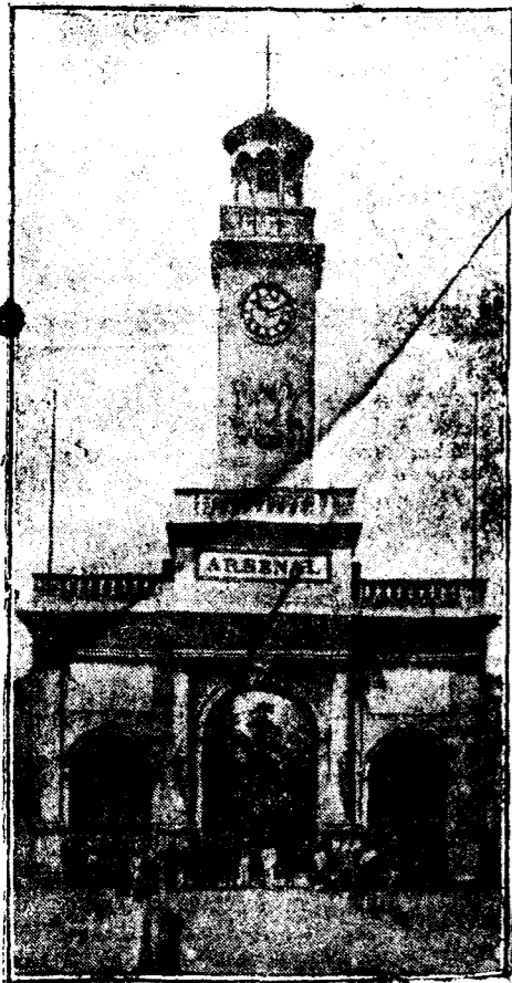
CARTAGENA.—Puerta del Arsenal.

De origen cartaginés, aunque algunos atribuyen su fundación a Teuro, después de la guerra de Troya llegó a adquirir en la Edad antigua la ciudad de Cartagena esta importancia, que Estrabón la consideraba como la principal de la región Iberia. Por ella la España romana, y Tito Livio sentaba de una ciudad, ciudad la más importante por sus muros, su puerto, su fortificación, el templo de Juno y en ella se celebraban las fiestas de la Victoria y las de la Libertad. En la Edad Media, y más tarde en la Edad Moderna, Cartagena fue una de las ciudades más importantes de España. En la actualidad, Cartagena pertenece a la categoría de ciudad.