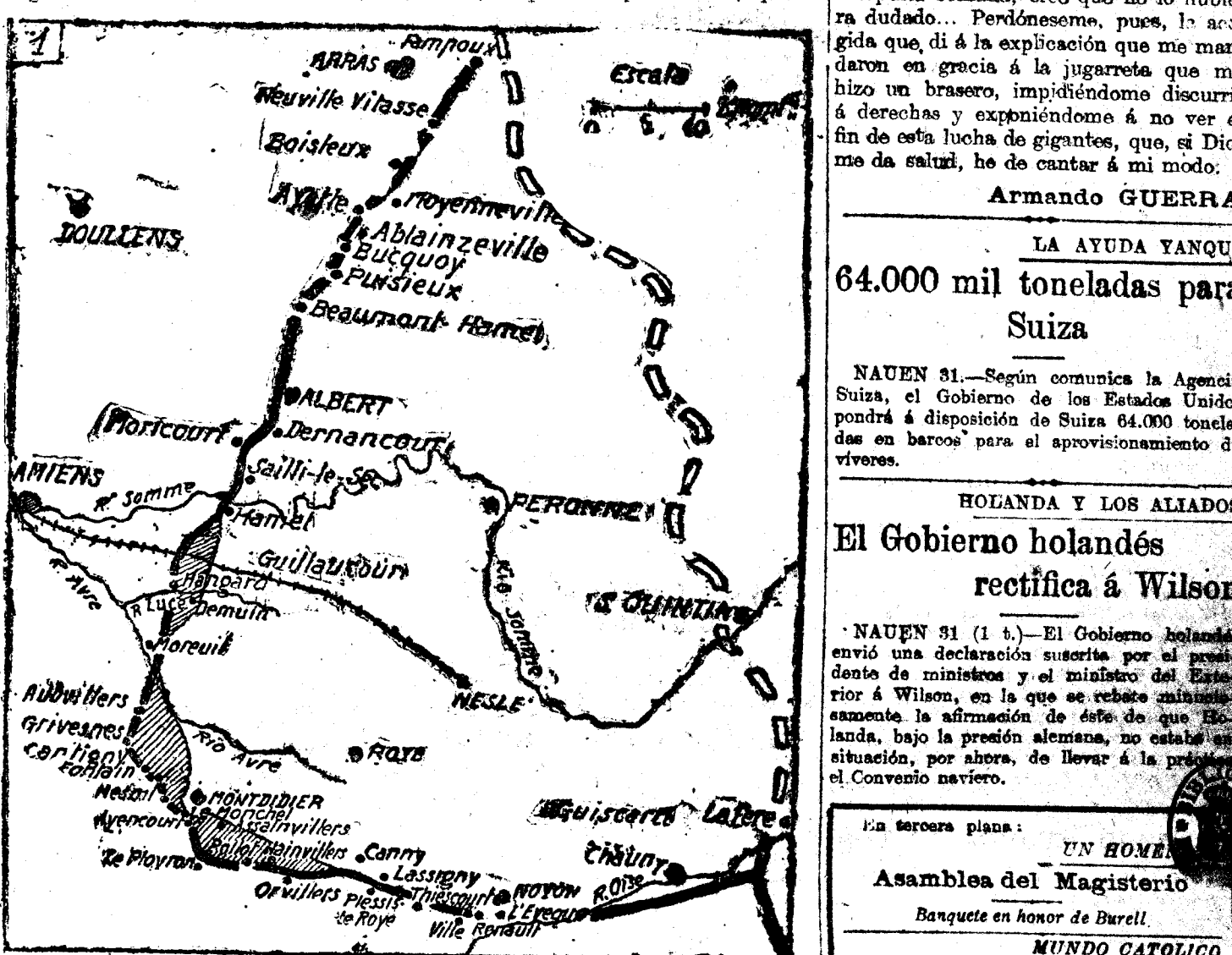
Posición que ocupaban los alemanes el día 21 de Marzo.

Los alemanes han fracasado. Así hablan los franceses. Oigamos contar el fracaso á los ingleses. Telegrama de Londres del 31, á las doce de la tarde: «Los alemanes han tomado los pueblos de Aubillers, Grèvesnes, Cantigny, Mesnil-St-Georges, Le Monchel y Ayencourt.» Además (según el parte alemán), perdieron los franceses el pueblo de Fontaine, y si recordamos que hace dos días fueron arrojados los alemanes de ese punto, de Mesnil y de Monchel, hay que pensar mucho para atinar por qué dirán sus enemigos que han fracasado las tropas de Hindenburg. guerra es un sport en el que se trata de la caza del hombre. Bien claramente dice el gráfico que estamos en presencia de un período rudo de lucha en que los avances son pequeños (indicados quedan en el croquis por las zonas rayadas); pero aun así, ello no existe, y téngase en cuenta que al décimo día de estar batallando franceses é ingleses han tenido sobrado tiempo para llevar al campo de batalla hasta las divisiones que tenían en Italia. Además (telegrama de Paris), el mal tiempo aumenta las dificultades del enemigo, haciendo que el desplazamiento de su artillería sea más penoso. He aquí el momento indicado para atacar en Italia, poniendo así en un brete á los aliados, sin saber á qué zona atender; momento que seguramente aprovecharán los austroalemanes, si pueden aprovecharlo, que el