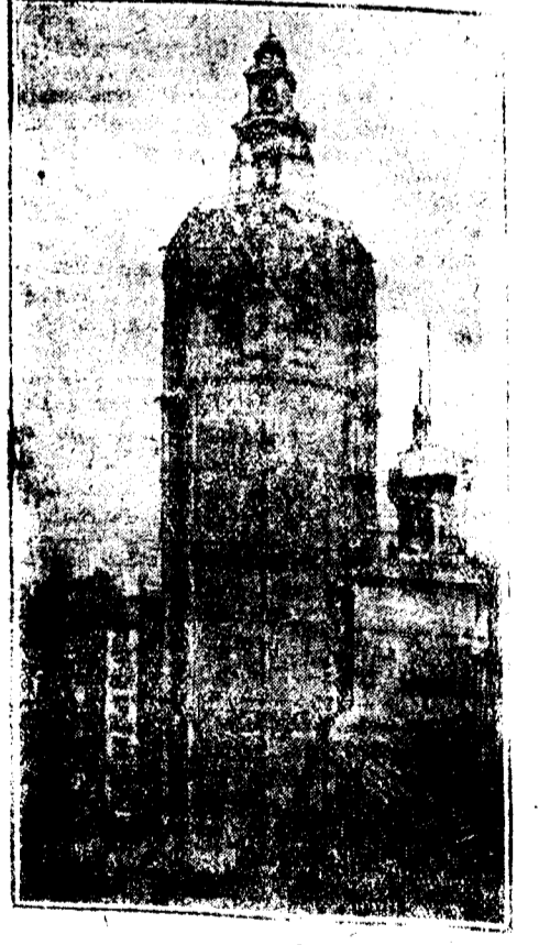
TORRE DEL MIQUELETE

¡Herniados! Nada de ofertas, hechos Siempre que sea pedido por un médico el vendaje SIBGEN se remite gratis á cuantos enfermos lo soliciten, via hacer efectivo su importe hasta después de ensayar sus resultados, que, de no ser satisfactorios, se devuelve. Pídale el catálogo instructivo á D. Ramón M. Fornas, SAN VICENTE, 111, ENTRESUELO. VALENCIA.