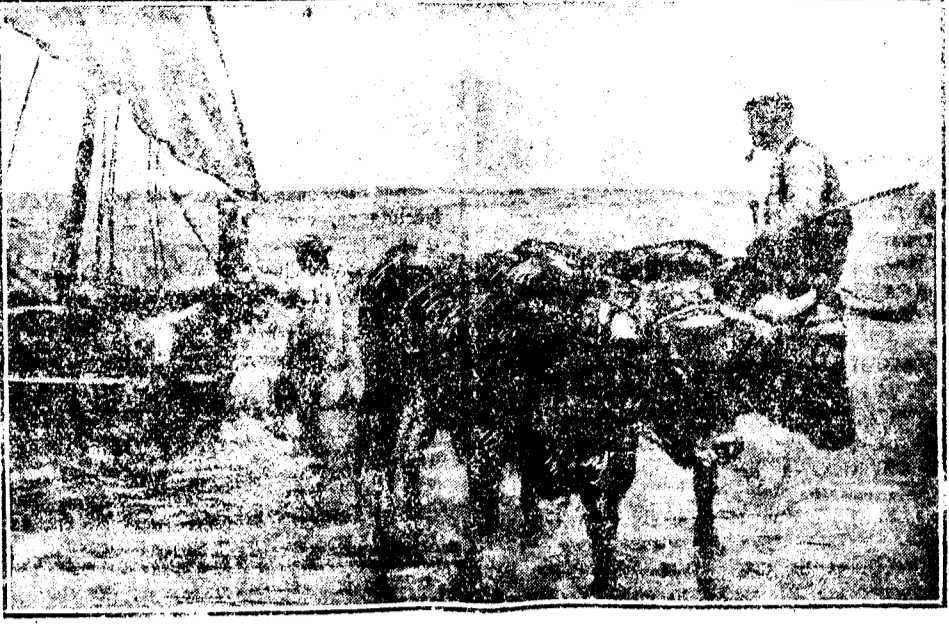
REGRESO DE LA PESCA DEL BOU, EN EL GRAS

Taller de maquinaria eléctrica de V. Ferrando Gay Proyectos de instalaciones eléctricas de alta y baja tensión Motores, dinamos, alternadores, transformadores Saltos de agua e instalaciones de riego Reparación de toda clase de maquinaria eléctrica Avenida del Puerto, 119. Teléfono 1.163 :: VALENCIA ::