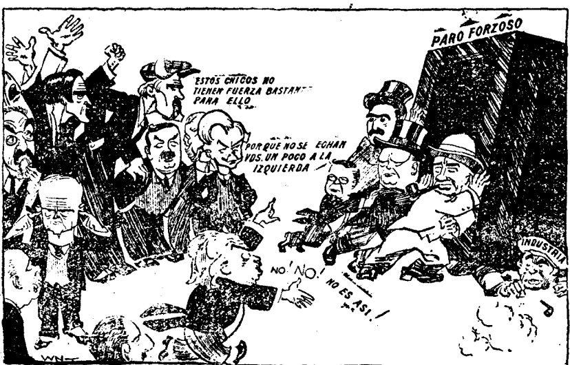
EL ESPECTADOR.—Bueno, ya habéis hablado bastante. Conveniría que os pusierais a ayudar con vuestro propio plan. ("Glasgow Bulletin".)