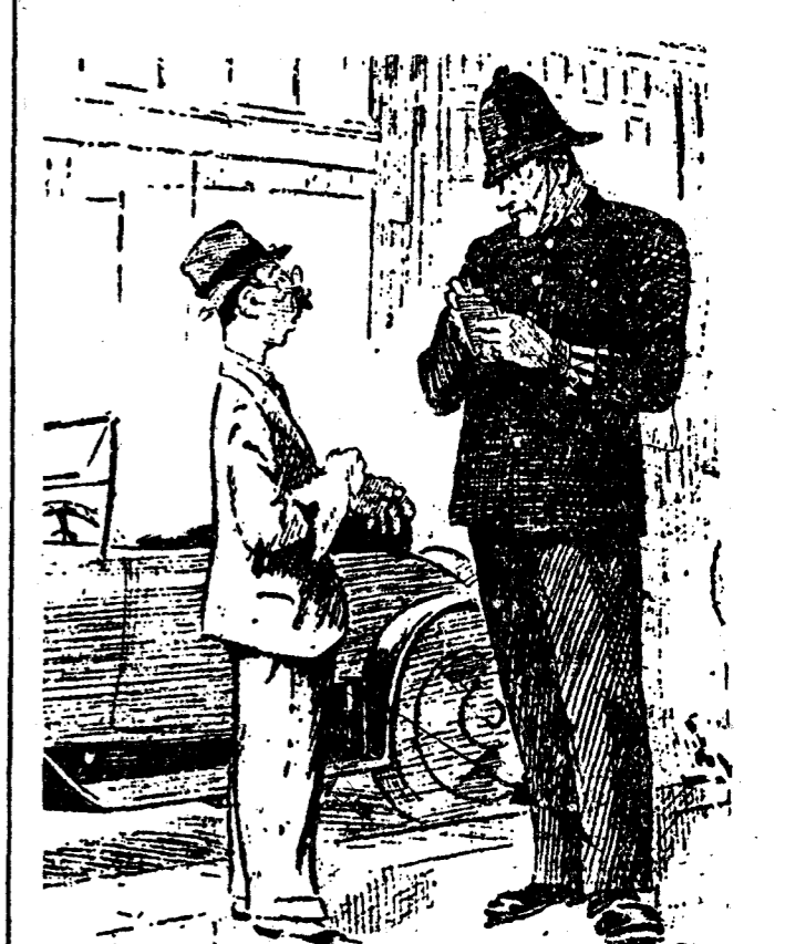
—¿Por qué tanta prisa? —¡Iba muy lejos a pagar una cuenta. —Perfectamente; pase usted a hacerla efectiva en la Comisaría.