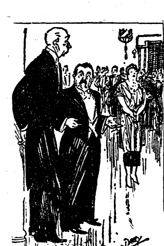
LOS QUE NO CONOCEN A NADIE EN LA REUNION —¿Quiere que le presente a esa señora? —No se moleste. Es mi mujer.