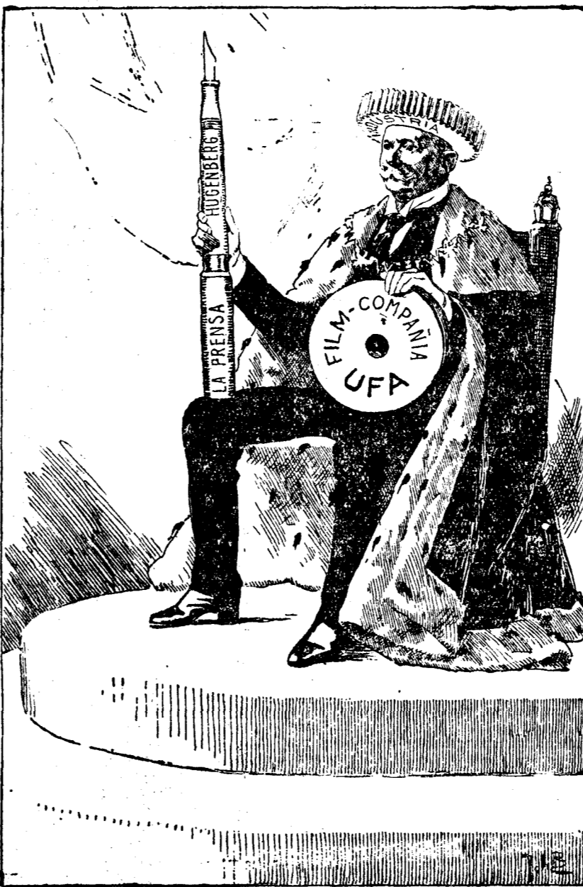
UN REY INTERINO CON ARMAS BIEN PODEROSAS