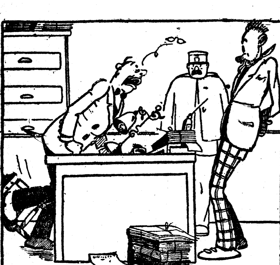
—¡Usted ha comido sin pagar en dos restaurantes! No lo niegue, porque mandq que le hagan la autopsia.

Avisos a GAS-MADRID, S. A.: Ronda de Toledo, núm. 8. Teléfono 71.440, y a las sucursales: Alcalá, 43; Pozas, n.º 2; Barbieri, 20; Serrano, 52; Plaza Chamberí, 2; Marqués de Toca, 9.