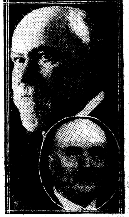
Las dos figuras culminantes de la crisis: Poincaré y Caillaux

Ayer por la mañana enviaron a Poincaré una carta para darle cuenta de la decisión Se asegura que Poincaré será encargado otra vez de formar Gobierno La actitud del partido radical derribando al Gabinete de U. N. es unánimemente censurada PARIS, 6 (a las 13, por teléfono).—El Gobierno Poincaré acaba de presentar la dimisión. Los ministros radicales Sarraut, Herriot, Perrier y Queuille, obligados por una decisión del Congreso de Angers, entregaron al presidente del Consejo una carta colectiva dimitiendo sus carteras. Poincaré reunió inmediatamente el Consejo de ministros, que terminó a las doce y media, con el acuerdo de plantear la crisis total. Barthou anunció a los periodistas la noticia, mientras el jefe del Gobierno se dirigía al Eliseo para entregar al presidente de la república la dimisión de todo el Gobierno. La carta de dimisión dice así: "Señor presidente de la república: Acabo de recibir las dimisiones de mis