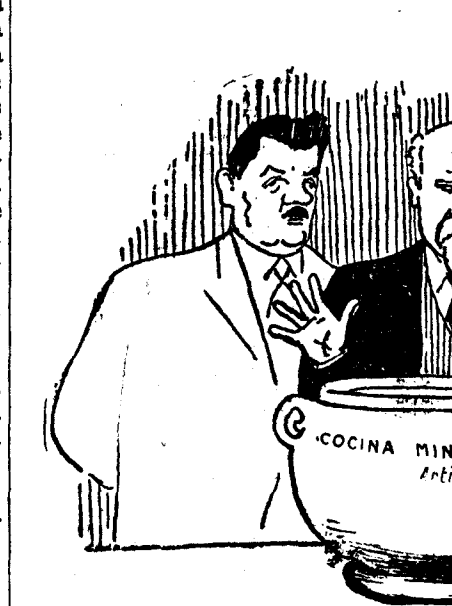
POINCARÉ.—Ha sido su pipa de usted, Herriot, lo que nos ha caído en la sopa. ("La Victoire", París.)

no se ve un Gobierno viable fuera del que existía. De ello el verdadero responsable es Poincaré. Si el presidente del Consejo hubiera tenido el valor de recoger a los que desean estar bajo su Jefatura, haciendo caso omiso de los radicales, que le soportan, pero no le estiman, hoy habría en la Cámara una mayoría definida que podría muy bien gobernar sin los radicales. Poincaré dejó que el centro se fraccionara en múltiples grupos sometidos a la atracción de la masa radical y al temor de pasar por reaccionarios. Ahora—la nación—toca las consecuencias.