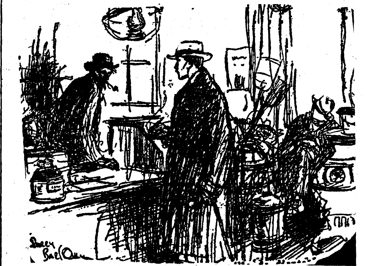
LAS DELICIAS DEL CAMPO —Un cepillo de dientes. —No hemos recibido todavía las novedades de verano. ("The Humorist", Londres.)