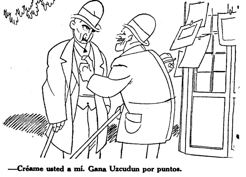
—Cráame usted a mí. Gana Uzcudun por puntos.