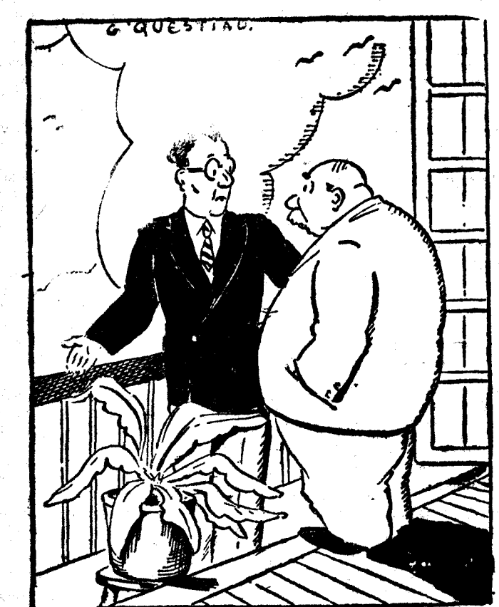
—¿Por qué sales tú al balcón cuando canta tu mujer? —No quiero que supongan los vecinos que sido yo. ("Dimanche Illustré", París.)