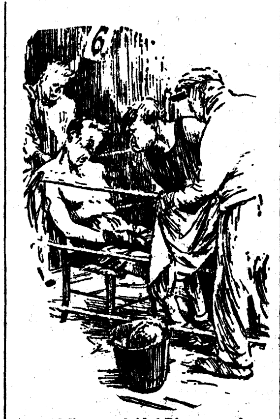
—¡Valiente estúpido! Dice que está agotado y está fresco como una lechuga. EL BOXEADOR (que lo ha oído).—Sí... ¡en ensalada! ("Punch", Londres.)