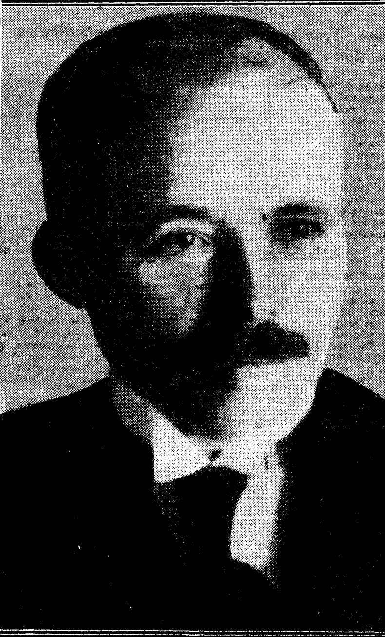
M. Juan María Musy, jefe del partido católico suizo, que ha triunfado recientemente en las elecciones

Musy tiene en la actualidad cincuenta y dos años. Estudió Derecho en la Universidad de Friburgo, Munich y Berlín, y ejerció la carrera desde 1906 a 1910. En 1912 entró en la política y fué el jefe en su cantón del partido católico. En 1914 ingresó en el Consejo Nacional. En 1919 reemplazó a M. Ador en el Consejo Federal, desde donde dirigió las finanzas del país con acierto. En 1925 fué elegido presidente de la Confederación Helvética. Musy es un hombre muy apegado a su suelo natal. Tiene gran afición a la cacería y pasa en este entretenimiento sus ratos ociosos en las cumbres de los Alpes de Friburgo.