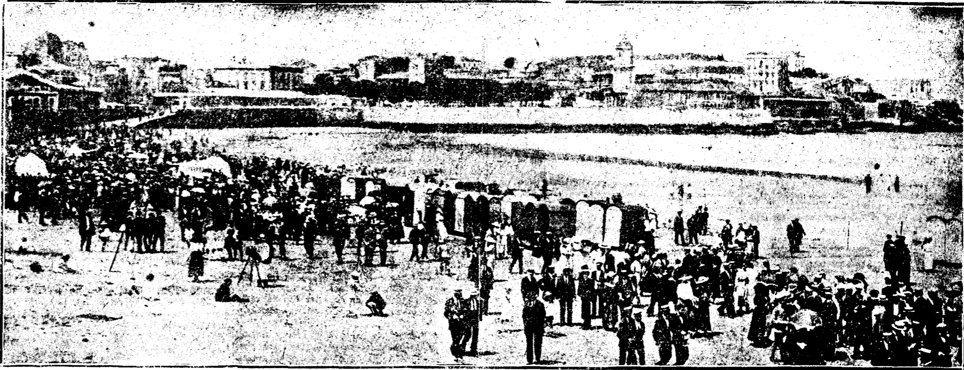
Vista de la playa de Gijón

*** Sentados en la terraza espléndida del estupefacto pabellón que el Real Club de Regatas habilitara sobre las rocas bravas, apreciamos en el carácter de nuestro amigo el carácter asur, que goza fama de laborioso y sufrido, pensador y constante en sus propósitos. En nuestra mente se revuelven las tres palabras que él pronunciara como características de un pueblo que sabe vivir en todas las épocas: tradición, laboriosidad, aristocratismo. Miramos tierra adentro, y el influjo del paisaje surge el recuerdo de la empresa que Pelayo comenzara, y a la cual otros héroes pusieron digno término en los matorrales de Granada. El miradillo etna nuestra atención hacia la costa, en donde la ciudad industrial y productora se refleja por un movimiento constante en sus muelles. Y al frente, entre los dos azules, el del mar y el del cielo, purísimos ambos, a pleno sol, unos balanderos, henchidos sus velas blancas, surcan las aguas mansas, blandamente... sin disputa... Días vendrán, y ellos no están lejanos, en que las navéculas, patronadas por distinguidos deportistas, pugnarán por defender el prestigio de que sus nombres gozan a través de la historia de este aristocrático deporte.—P.