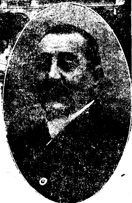
D. Hermenegildo Gandarillas, alcalde de Palencia