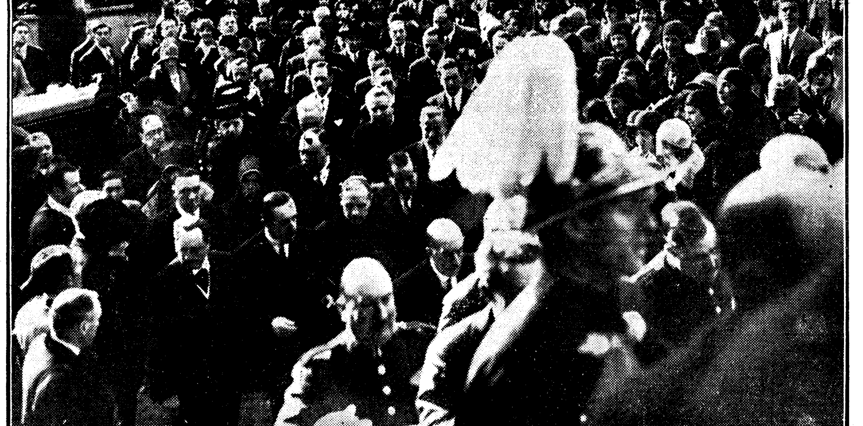
DE LA ESTANCIA DEL REY EN BARCELONA.—Su majestad visitando los pabellones del Hospital de Santa Cruz y San Pablo, después de inaugurar oficialmente el benéfico establecimiento.