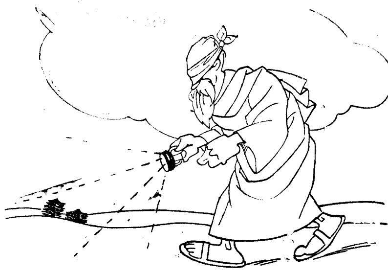
—Nada; no encuentro hombres nuevos.