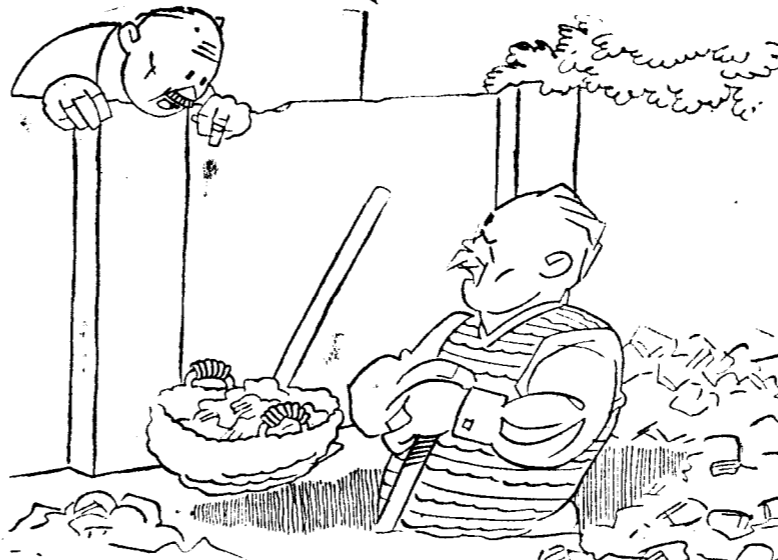
—¿Qué tal, vecino? ¿Plantando árboles? Yo creí que eso se hacía en diciembre. —No, señor; los frutales, ahora. En diciembre los árboles de Noel.