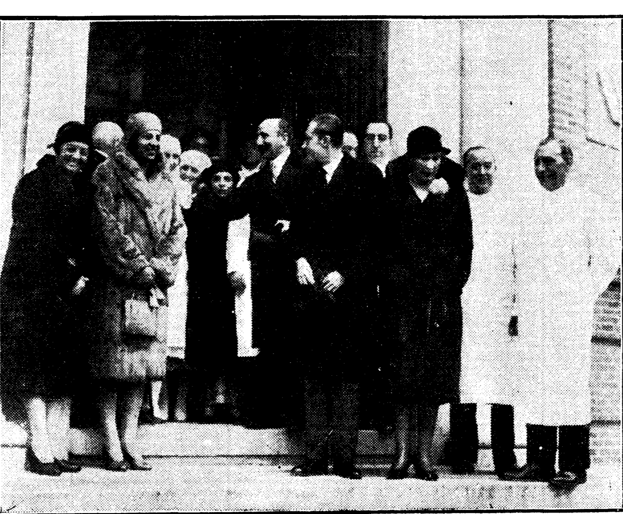
El Príncipe de Asturias al salir del Hospital de San José y Santa Adela, donde presidió una sesión clínica. En la fotografía se ve también a su majestad la Reina y a la infanta doña Beatriz.