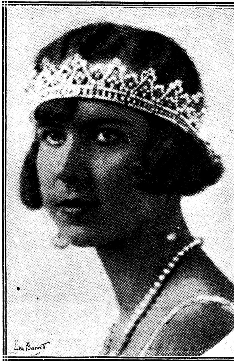
La princesa María José de Bélgica, que hoy contraerá matrimonio en Roma con el príncipe Humberto, heredero de la corona de Italia