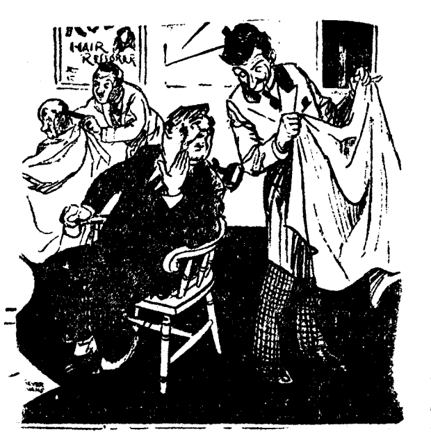
EL PELUQUERO.—¿Afeitarse o cortar el pelo? EL CLIENTE.—No; pronto, ¡póngame una toaca caliente por la cara! Aquel del rincón es mi sastre. ("The Humorist", Londres)