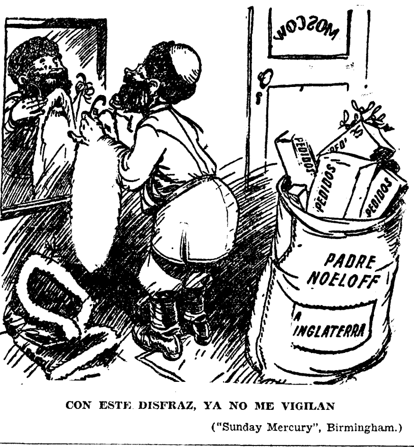
CON ESTE DISFRAZ, YA NO ME VIGILAN ("Sunday Mercury", Birmingham.)

tudios y reglamento de la Escuela Nacional de Sanidad en el término de dos meses. La cobranza de las cuotas para los organismos paritarios Por real orden de Trabajo que aparece ayer en la "Gaceta" se delega en las Cajas generales de Ahorros la cobranza y percepción de las cuotas sobre la contribución industrial y la de utilidades, así como de las cuotas que pudieran establecerse fuera de estas dos, al fin del sostenimiento y perfecta organización económica de los organismos paritarios.