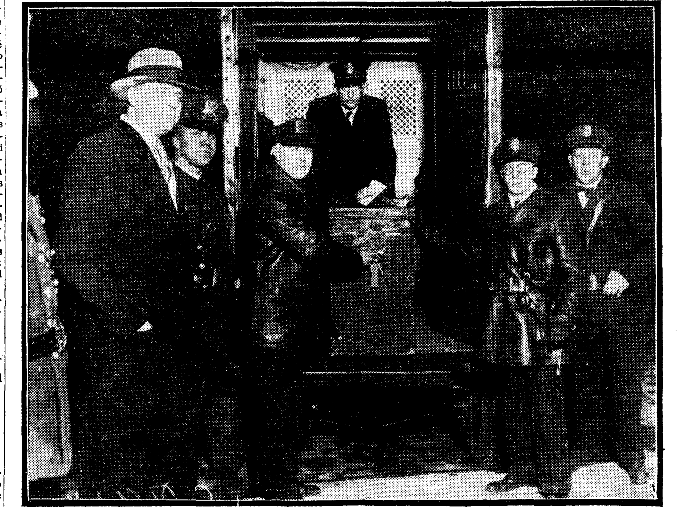
No siempre ocurren cosas graves en Chicago cuando se traslada dinero de un Banco a otro. En la "foto" se ve una "cajita" que contiene más de un millón de dólares, y que fué trasladada sin contratiempo.