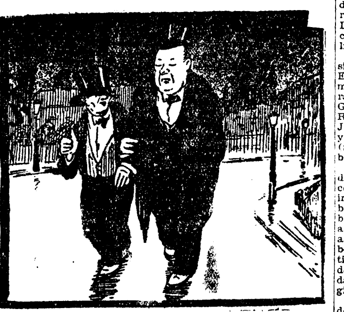
—¿Habría razón para matar al que cambió nuestros sombreros!... ("Lustige Kölner Zeitung", Colonia)