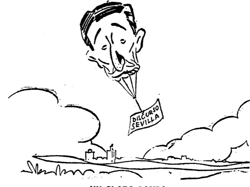
UN GLOBO SONDA