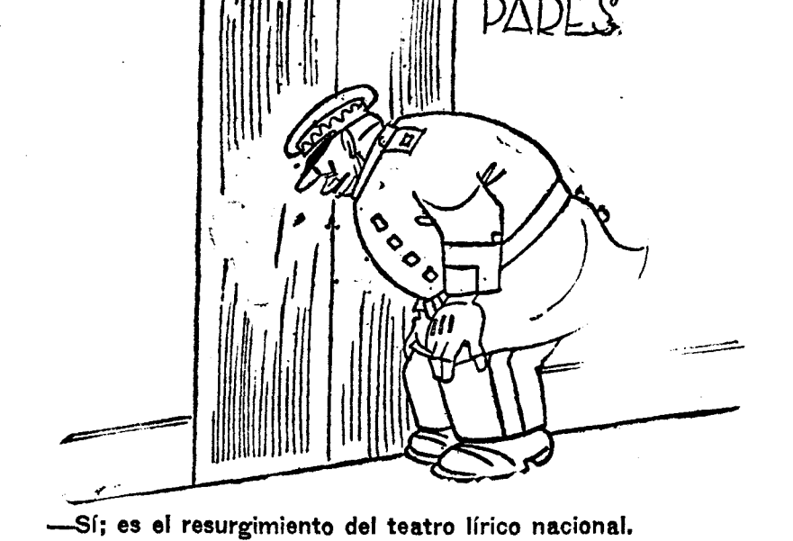
—Sí; es el resurgimiento del teatro lírico nacional.