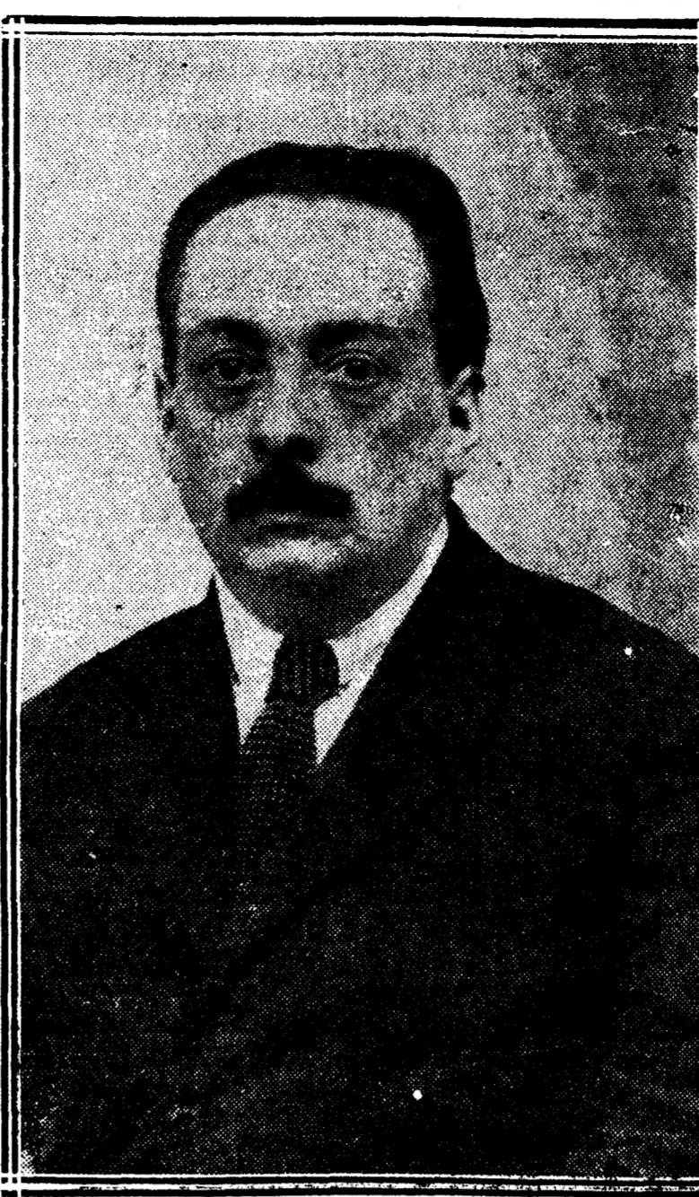
Don Blas Cabrera, que ha sido nombrado rector de la Universidad Central

Don Blas Cabrera es catedrático de la Facultad de Ciencias de la Universidad de Madrid y es una figura notable en la ciencia española. Sus trabajos matemáticos y de Física superior y, muy particularmente, los relativos al magnetismo, le han valido un prestigio en las esferas internacionales. Es director del Laboratorio de Investigaciones Físicas, fundado en 1911, y dirigirá el nuevo Instituto sufragado por la Institución Rockefeller. Ha dado cursos en numerosas Universidades hispanoamericanas y en pocas europeas, como la Sorbona, Munich, Berlín y Zurich. Sus obras y publicaciones científicas pasan del centenar.