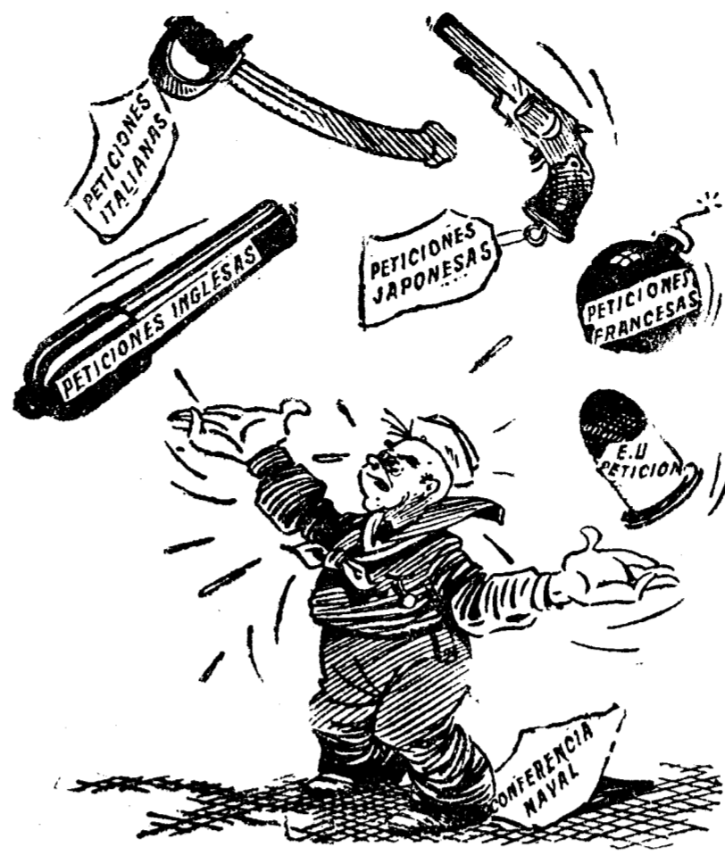
JUEGOS MALABARES ("Brooklyn Times")

flota el deseo de llegar a la constitución de un partido de derechas con nuevas normas. No se cree en el anunciado partido agrario. En cambio, se ve con gran simpatía, y en cierto sector hasta con gran cariño, la agrupación que se asegura llegará a formarse a base del señor Cando, el conde de la Mortera y otros prohombres. Sin embargo, los mauristas están supeditados a las órdenes y orientaciones que esperan recibir del conde de Vellejano.