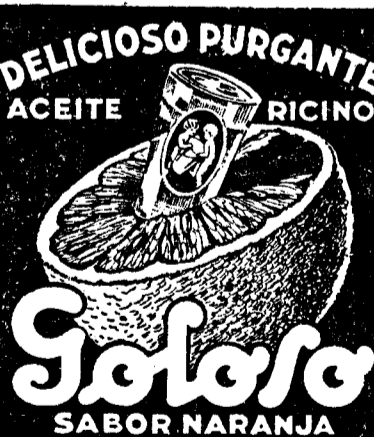
DELICIOSO PURGANTE ACEITE DE RICINO. Sabor Naranja.