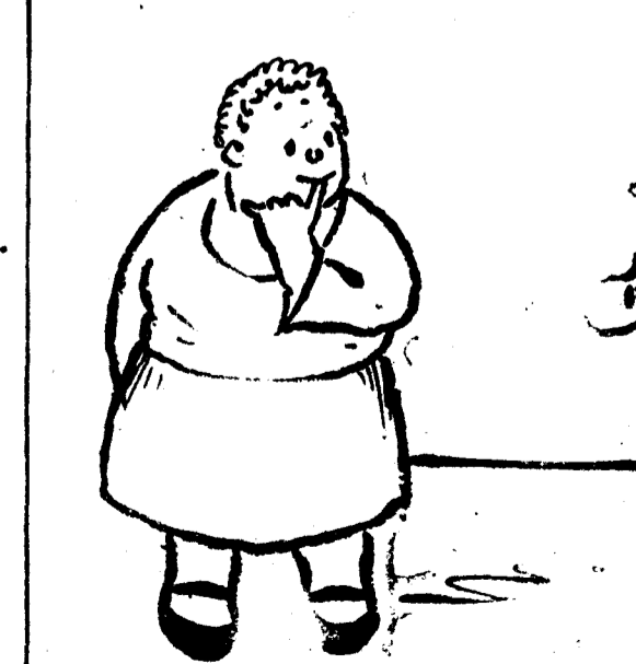
—¡Gran noticia, querida! ¡Me han elegido concejal! —¡Ah! ¡Muy bien! Haz el favor de informarme de qué vestidos debe hacerse la mujer de un concejal. ("Pages Gales", Iverdon.)