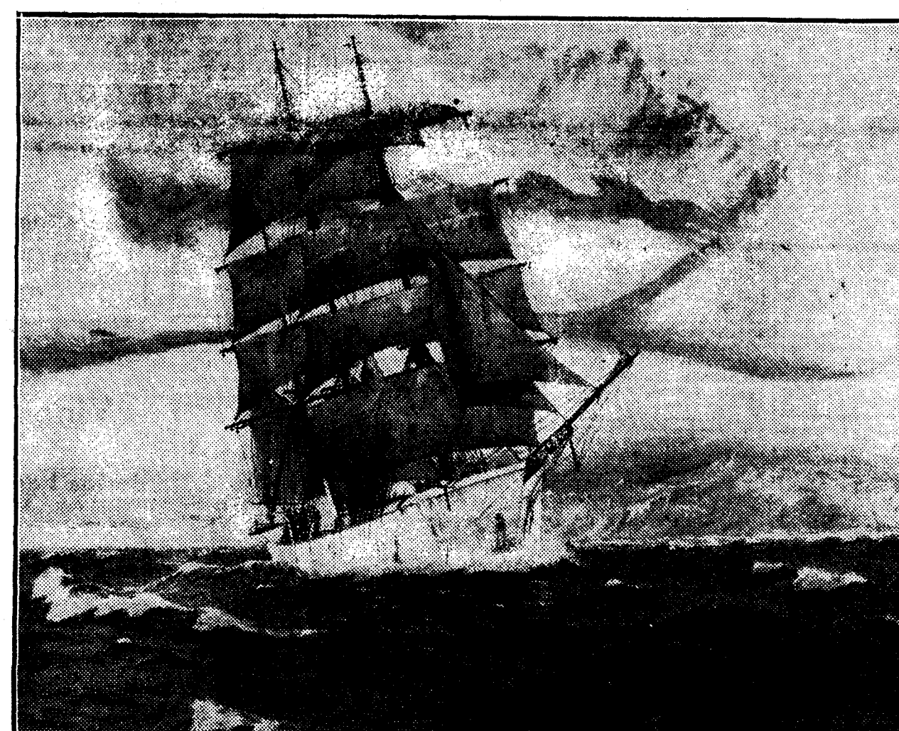
Fotografía del cuadro pintado por Charles Roemer y que representa el rompimiento de Byrd en los mares del Sur.