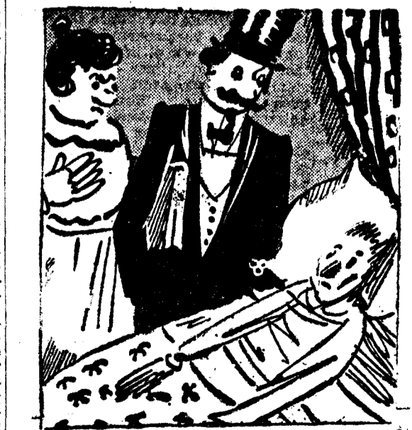
—Señor notario: Mi marido está muy enfermo y ha llamado a usted para dicitarle "mis" últimas voluntades. ("Félic-Mété", Paris.)

Al efectuar sus compras, haga referencia a los anuncios leídos en EL DEBATE