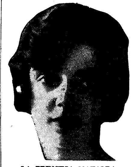
LA PRINCESA MAFALDA

Después de la recepción, el Pontífice se dirigió a la Escuela Pontificia de Música Sacra, donde recibió a los alumnos y profesores. Después de la recepción, el Pontífice se dirigió a la Escuela Pontificia de Música Sacra, donde recibió a los alumnos y profesores.