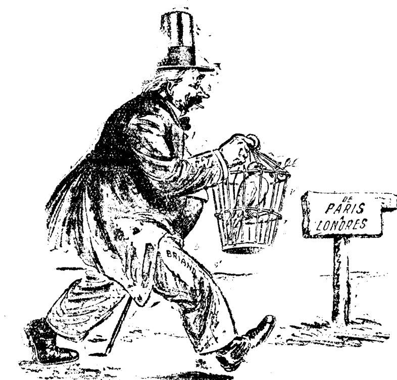
Y Briand sigue...